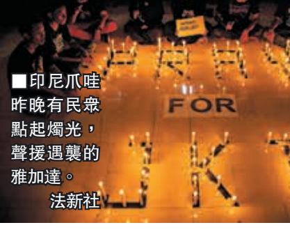
■印尼爪哇昨晚有民眾點起燭光，聲援遇襲的雅加達。