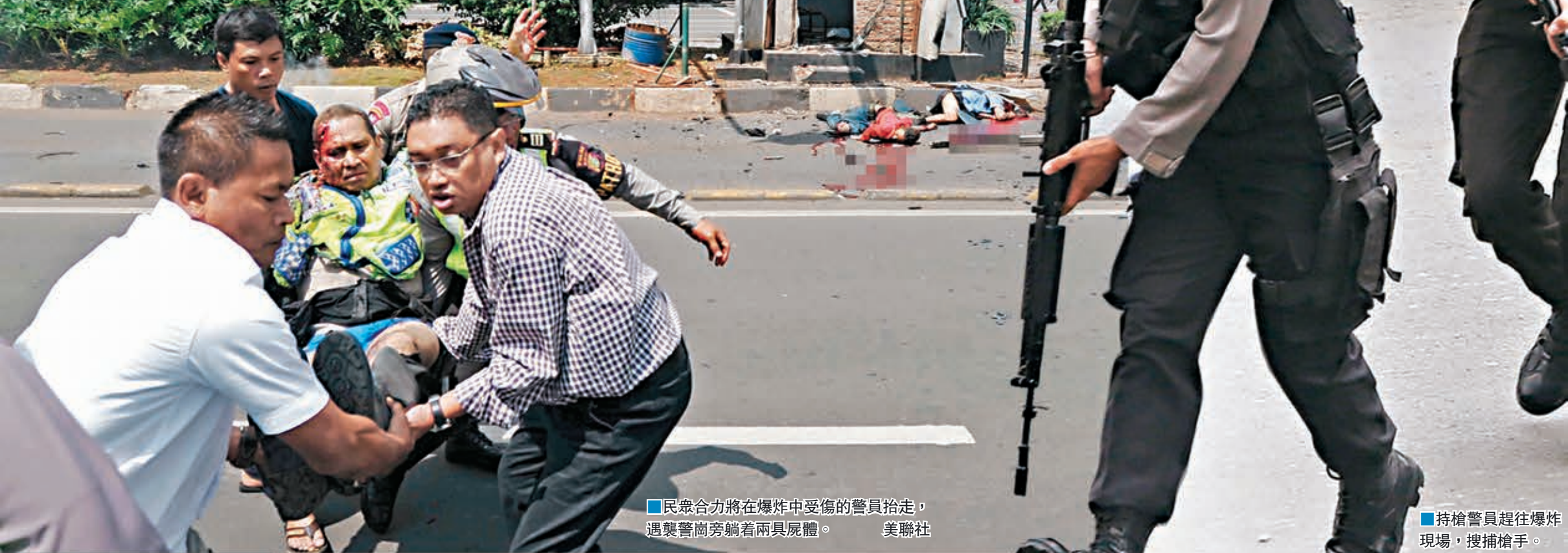
■民眾合力將在爆炸中受傷的警員抬走，遇襲警崗旁躺著兩具屍體。