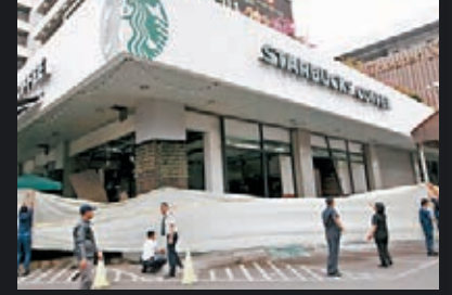
■警方封鎖遇襲的星巴克進行調查。