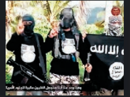
■菲律賓有武裝組織早前發放短片，宣稱效忠「伊斯蘭國」。