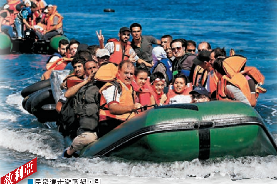
敘利亞 民眾遠走避戰禍，引發難民危機。資料圖片

突尼斯的反民主運動，源於小販布瓦吉吉不滿遭警察驅趕而自焚抗議，觸發民眾怒火，示威愈演愈烈，將統治者本·阿里推走。民選政府上台後推動民主，由各派組成的「突尼斯全國對話大會」協助國家過渡民主政制，去年更獲頒諾貝爾和平獎。然而，突尼斯近年聖戰暴力頻生，外國遊客成為襲擊對象，令民主發展蒙上陰影。