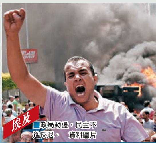
埃及 政局動盪，民主不進不退。資料圖片