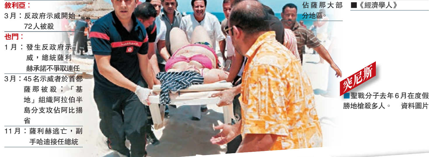
突尼斯 聖戰分子去年6月在度假勝地槍殺多人。資料圖片