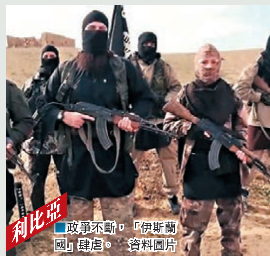
利比亞 政爭不斷，「伊斯蘭國」肆虐。資料圖片