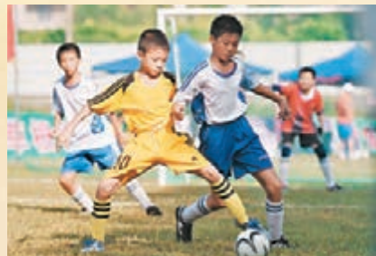
▲一群青少年在廣西一體育訓練基地進行足球比賽。資料圖片

體育教育 香港文匯報訊(記者 唐琳 南寧報道)全國青少年校園足球國家級專項培訓日前在廣西舉行,來自廣東、安徽、甘肅等8省1,332名中小學足球特色學校校長將在廣西體育高等專科學校進行為期5天的足球教育方面的培訓。