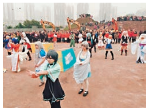
▲重慶動漫主題公園開工儀式上的cosplay表演。

暨重慶動漫創谷公園計劃用5年時間,建設成為975畝的新型城市公園。公園一期將於2017年10月建成並開園,建成後將作為重慶文化品牌中國西部動漫節的永久舉辦地。據不完全統計,重慶的活躍性動漫迷約有12萬人,但重慶卻無一家大型的綜合性動漫主題公園可供漫迷進行交流。而重慶動漫創谷公園建成後,將填補這個空白。公園將植入動漫主題,結合地形特點和生態環保要求,借助現代科技手段精心打造「兒童功能區」、「青年功能區」和「家庭功能區」。