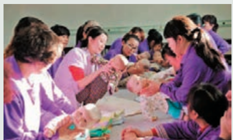
▲「二孩政策」催生「月嫂熱」。圖為湖北十堰家政服務公司加大月嫂培訓力度。

新政新風 香港文匯報訊(記者 梁珊珊 武漢報道)昨日,湖北通過計生新政,明確指出「提倡一對夫妻生育兩個子女」,對於符合生育規定的婦女,可享受128天產假,其配偶享受15天護理假(港稱侍產假)。