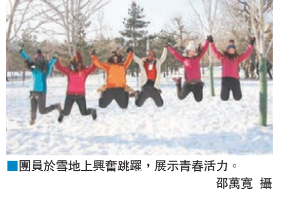
■團員於雪地上興奮跳躍，展示青春活力。