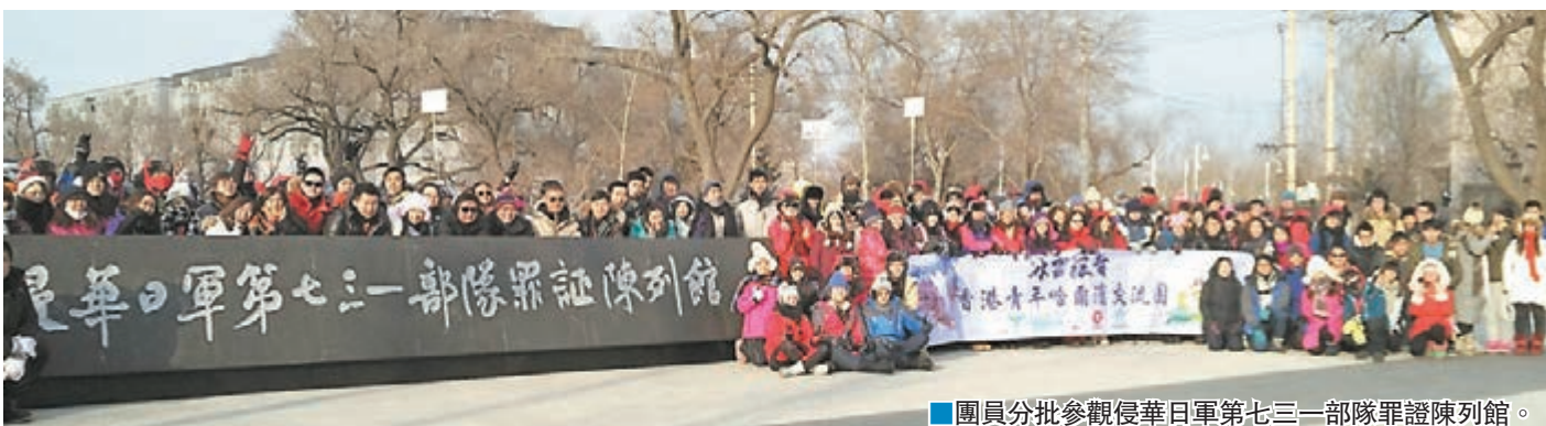
■團員分批參觀侵華日軍第七三一部隊罪證陳列館。