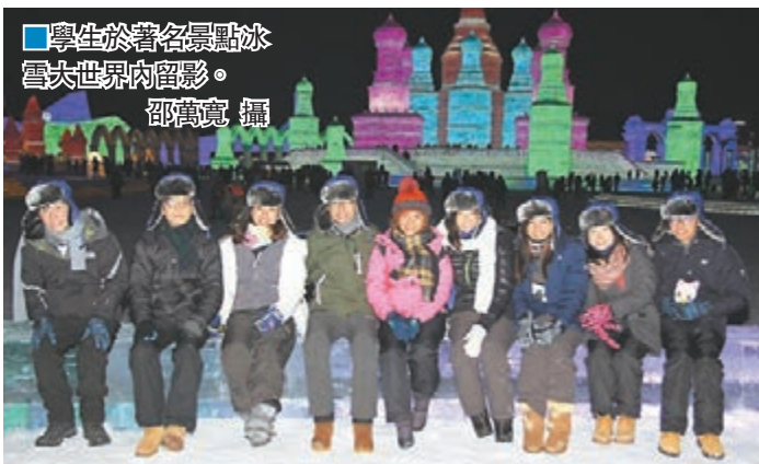
■學生於著名景點冰雪大世界內留影。