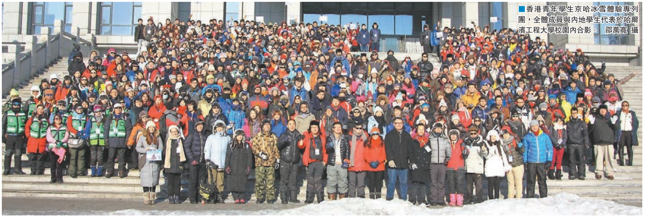
■香港青年學生京哈冰雪體驗專列團，全體成員與內地學生代表於哈爾濱工程大學校園內合影。

香港文匯報訊（記者 邵萬寬）由香港各界青少年活動委員會舉辦的「香港青年學生京哈冰雪體驗專列」活動，1月5日至9日組織約六百名香港青年學生乘坐專列經北京前往哈爾濱，透過參觀拜訪、與當地學生交流互動，開拓青年學生的視野，在領略祖國美好江山、體驗冰雪風情的同時增進兩地青年交流，活動取得圓滿成功，全體團員滿載而歸。