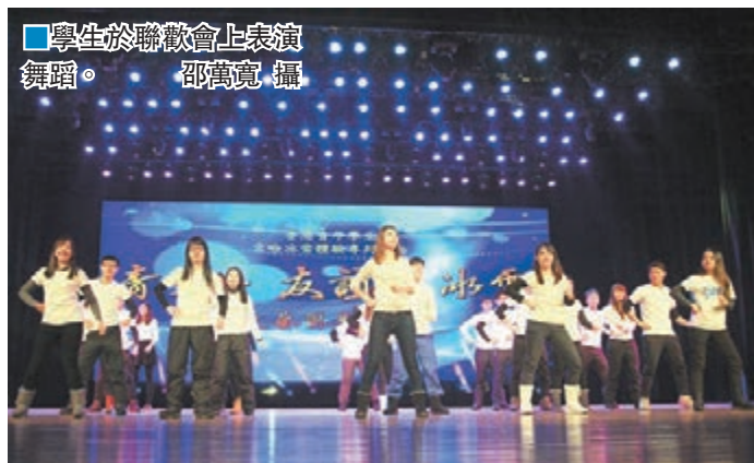
■學生於聯歡會上表演舞蹈。