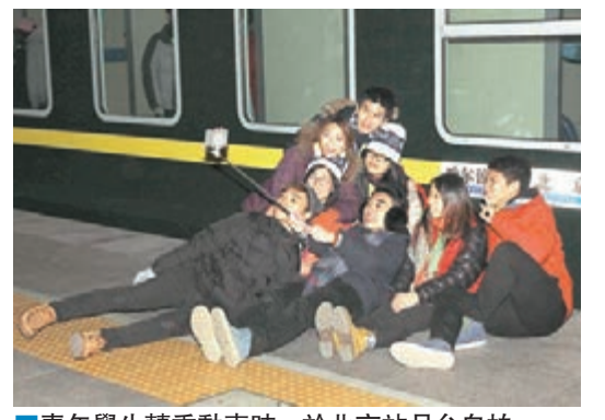
■青年學生轉乘動車時，於北京站月台自拍。