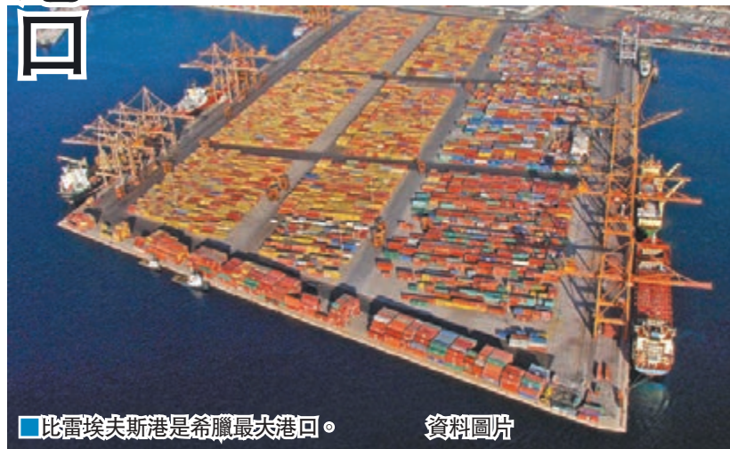
■比雷埃夫斯港是希臘最大港口。資料圖片