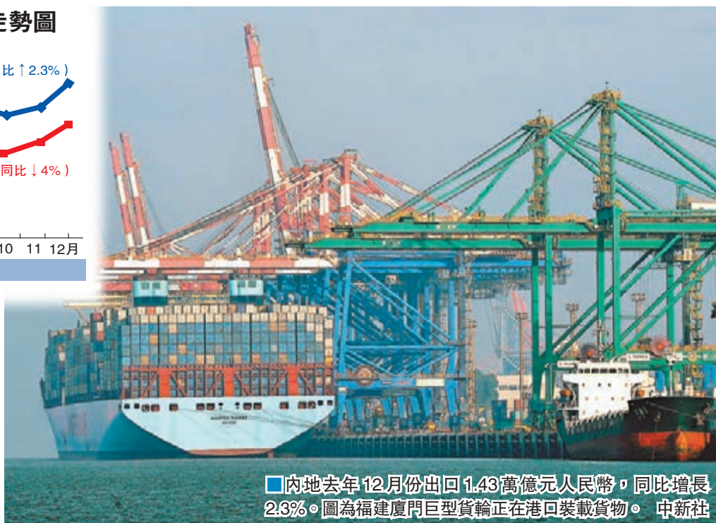
■內地去年 12 月份出口 1.43 萬億元人民幣，同比增長 2.3%。圖為福建廈門巨型貨輪正在港口裝載貨物。