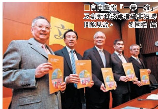
自由黨指「一帶一路」及創新科技等措施非短時間能見效。

香港文匯報訊(記者 鄭治祖)特首梁振英發表任內第四份施政報告，民建聯、經民聯等多個建制派政黨和議員，昨日先後肯定報告提出特首本人主持督導委員會推動「一帶一路」，能為香港明確把握國家「一帶一路」機遇，有利香港拓新發展，值得支持。報告在民生問題上亦能兼顧社會各階層訴求，積極務實，為本港長遠發展勾畫更清晰藍圖，期望梁振英在餘下任期繼續根據報告依法施政，為香港奠下長遠基礎。