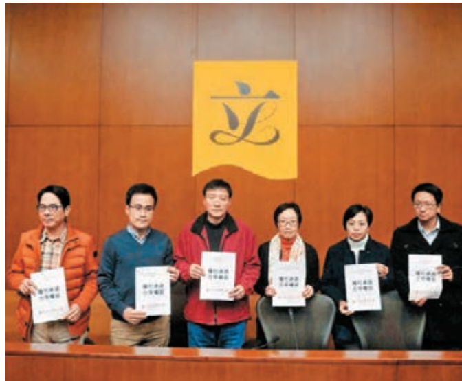
工聯會對報告沒回應多項勞工界訴求感到失望和不满。