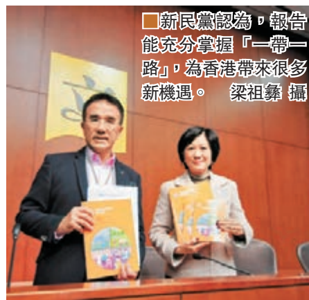
新民黨認為，報告能充分掌握「一帶一路」，為香港帶來很多新機遇。梁祖彝攝