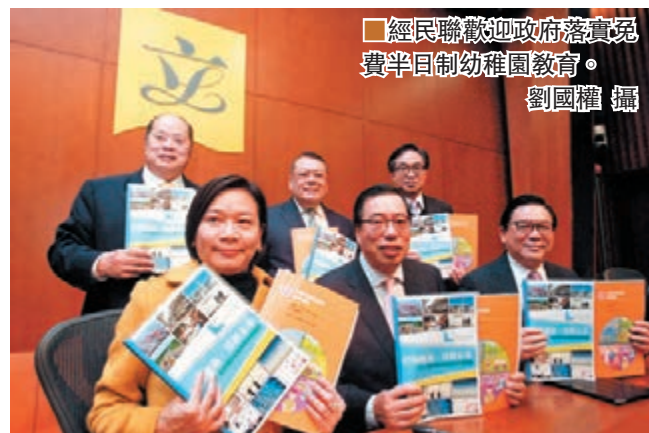
經民聯歡迎政府落實免費半日制幼稚園教育。