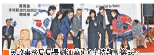
民政事務局長劉江華(中)主持啓動儀式。

香港業餘冰球會獲香港賽馬會慈善信託基金撥捐470萬港元,推行為期3年的「賽馬會冰球新世代發展計劃」,昨晚假九龍灣MegaBox舉行啟動儀式。「賽馬會冰球新世代發展計劃」上月開始接受報名,成功招募180名13至18歲、具備基本冰球技術的青少年接受培訓,並分成16歲或以下及18歲或以下2個組別,共合6隊進行為期9個月的訓練。記者 蔡明亮