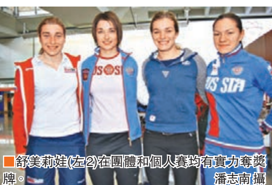
舒美利娃(左)在團體和個人賽均有實力奪獎牌。

俄羅斯女隊昨日在世界冠軍舒美利娃率領下抵港,舒美利娃和隊友都滿有信心的表示今次參賽目標是可以取得獎牌。舒美利娃透露在俄羅斯集訓了1個多月,今次是首度來港,不了解場地情況,但指出香港比起俄羅斯和暖得多。