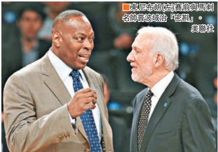
東尼布蘭(左)賽前與馬刺名帥波波維奇「密談」。

前幾季成績還算不賴的網隊,今季成績連連,連同周一在主場不敵馬刺79:106,現已變成全聯盟倒數第3位。俄羅斯富豪班主普羅霍羅夫近日立即叫停,炒教練及把總經理調職,並表明現要進行重建,意味着已放棄今季賽事。不過,普羅霍羅夫聲稱球隊距離「反彈」不遠,可盡快重返殺入季後賽的道路。