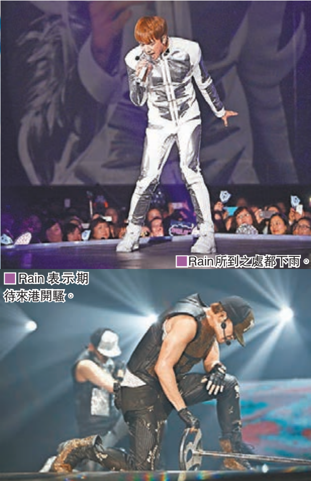
■ Rain表示期待來港開騷。