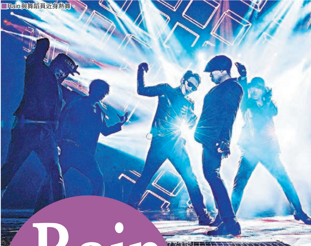
■ Rain與舞蹈員近身熱舞。