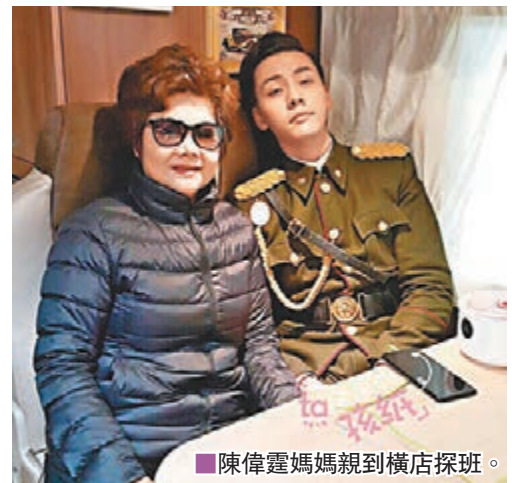
■ 陳偉霆媽媽親到橫店探班。