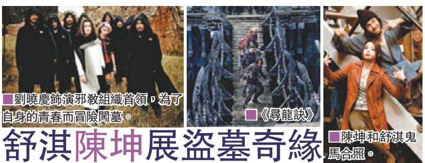
■ 劉曉慶飾邪教組織首領，為了自身的青春而冒險闖墓。

為活動擔任司儀的陳偉琪以性感打扮現身，其豐滿上圍相當「吸睛」，她表示給節目寵壞了，因經常要到高級餐廳品酒和試食。經常吃好的她，在剛渡過的新年亦有增減，是以要積極打籃球來減磅。