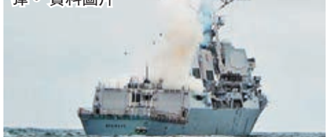
■美軍下一步現代化的武器將會是巡航導彈。