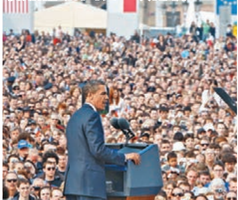
■奧巴馬2009年誓言裁核，他之後獲得諾貝爾和平獎。資料圖片

美國計劃在30年時間內，斥資1萬億美元(約7.76萬億港元)升級核武庫，去年在內華達測試的「B61-12」型新式核彈只是計劃的其中之一。