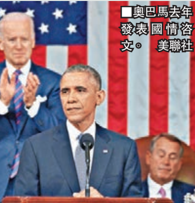
■奧巴馬去年發表國情咨文。