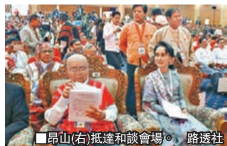
■昂山(右)抵達和談會場。

即將進行權力交接的緬甸，昨日在首都內比都舉行持續5日的首輪全國和平政治對話，全國民主聯盟(民盟)領袖昂山素姬、總統吳登盛及軍方領導人敏昂萊等均有出席，在會上與少數民族武裝組織領袖就停火協議進行磋商，希望化解自1948年獨立以來持續多年的衝突。