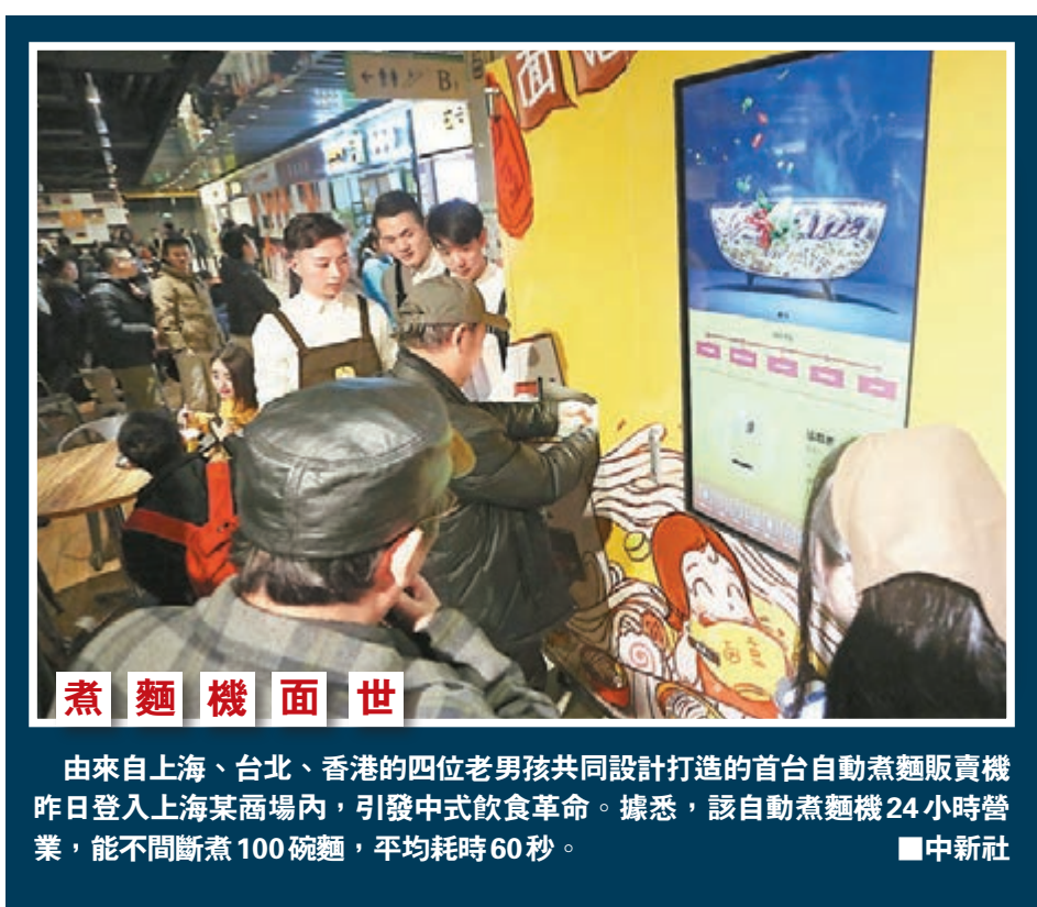
煮麵機面世 由來自上海、台北、香港的四位老男孩共同設計打造的首台自動煮麵販賣機昨日登上上海某商場內，引發中式飲食革命。據悉，該自動煮麵機24小時營業，能不斷斷煮100碗麵，平均耗時60秒。