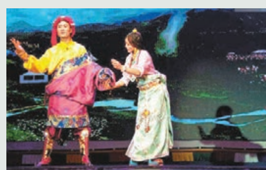
■ 根據《格薩爾王》史詩節選改編的歌舞劇《嘉洛婚禮大典》在成都首演。網上圖片

這部在內地西北部，尤其是藏區廣為傳唱的史詩，講述了英雄格薩爾王除惡揚善、統一多個部落的英勇事蹟。 ■ 新華社