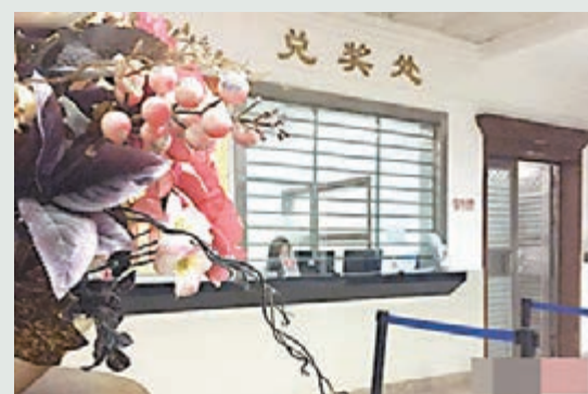
■ 東莞市福彩中心工作人員一直留守到晚上12點，但中獎者仍未現身。網上圖片

前日晚上12時，廣東東莞福彩中心的兌獎大廳燈火通明，工作人員仍在抱著最後的希望等一個人的到來——2565萬雙色球大獎得主。但遺憾的是，大獎得主最終沒有現身，去年11月10日在東莞烏石崗東區1巷6號的44100485投注站中出的兩注雙色球頭獎成了棄獎。總獎金2,565萬元將被納入福彩公益金，這也創造了多個紀錄：東莞、廣東乃至中國彩票史上最大棄獎。