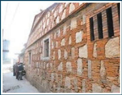
傳說馬可波羅曾到石頭街這條巷子。