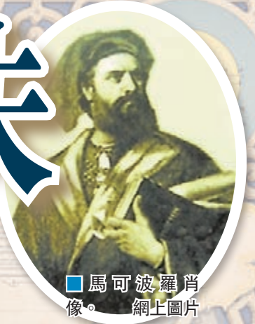
馬可波羅肖像。

眾所周知，意大利著名的旅行家馬可波羅(港稱馬可孛羅)元朝時曾來過福建泉州，但泉州有條馬可波羅巷，恐怕知道的人並不多。馬可波羅巷，原位於中心市區東海法石片區，聯合國專家1991年曾到位於馬可波羅巷的陳麗燕家中考察。近日有消息稱，若不再關注，馬可波羅巷將徹底消失在歷史長河中。