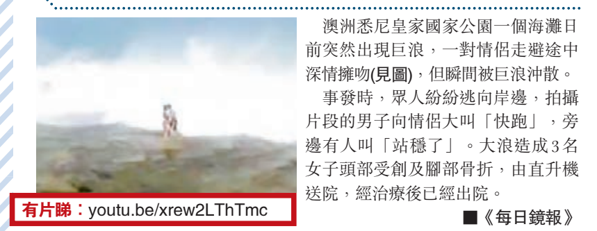
▲澳洲悉尼皇家國家公園一個海灘日前突然出現巨浪，一對情侶走避途中深情擁吻(見圖)，但瞬間被巨浪沖散。事發時，眾人紛紛逃向岸邊，拍攝片段的男子向情侶大叫「快跑」，旁邊有人叫「站穩了」。大浪造成3名女子頭部受創及腳部骨折，由直升機送院，經治療後已經出院。