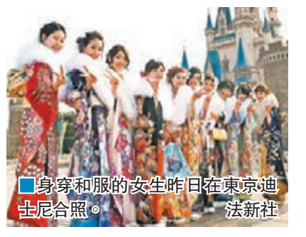
▲身穿和服的女生昨日在東京迪士尼合照。