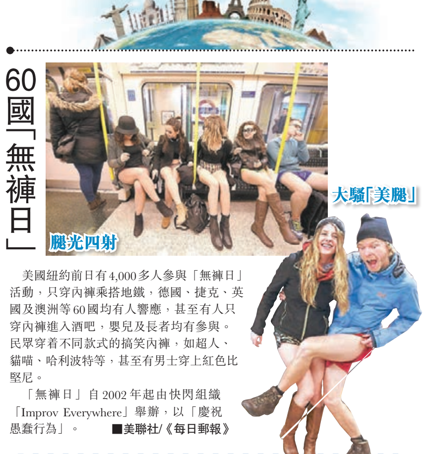
▲美國紐約前日有4,000多人參與「無褲日」活動，只穿內褲乘搭地鐵，德國、捷克、英國及澳洲等60國均有人響應，甚至有人只穿內褲進入酒吧，嬰兒及長者均有參與。民眾穿着不同款式的搞笑內褲，如超人、貓貓、哈利波特等，甚至有男士穿上紅色比堅尼。 「無褲日」自2002年起由快閃組織「Improv Everywhere」舉辦，以「慶祝愚蠢行為」。