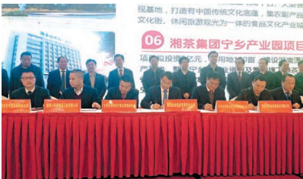
湖南長沙寧鄉經濟技術開發區,30重點項目日前現場簽約。

料、先進裝備製造、新材料及現代服務業四大主導產業。其中海信電器綜合生產基地、楚天智能醫療裝備產業園、湖南輕工鹽集團食品產業園、湖南國際保健化妝品產業園4個項目投資均在50億元以上;湖南糧食集團瀟湘食品文化產業城投資達30億元;好彩頭湖南運營中心及物流基地、王老吉大健康產業園投資達10億元以上;晶鑫科技食品包裝生產基地、酒鬼酒倉儲物流中心及灌裝基地投資達5億元以上。這些重點項目為寧鄉經開區各大主導產業的發展增添了強勁動能。