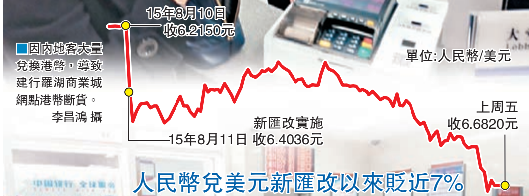
因內地客大量兌換港幣,導致建行羅湖商業城網點港幣斷貨。李昌鴻攝 港人擔憂人民幣資產縮水,以螞蟻搬家形式將內地存款回流香港。李昌鴻攝