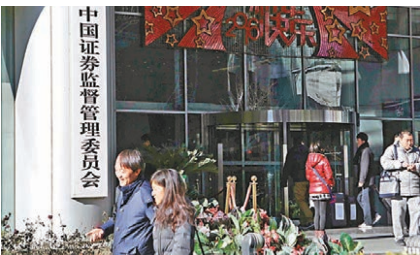
中證監鄧舸昨日表示,3月1日並不是註冊制改革正式啓動的起算點。