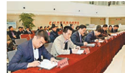
外貿企業、金融機構簽約入駐蘭州新區綜合保稅區。