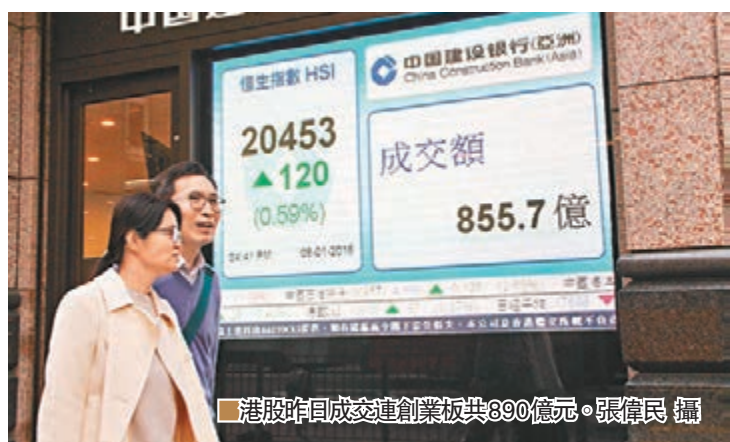
港股昨日成交量連創板共890億元。