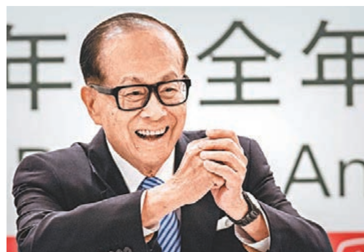
福布斯公佈最新香港50大富豪榜，李嘉誠以淨資產313億美元穩守榜首。資料圖片

香港文匯報訊（記者 吳婉玲）福布斯昨公佈2015年香港50大富豪榜，去年完成旗下長和系世紀重組的主席李嘉誠，今次繼續穩守榜首，連續18年成為香港首富，截至去年底坐擁淨資產達313億元(美元，下同)。至於人稱「四叔」的恒地(0012)主席李兆基，以及新世界(0017)發展創辦人鄭裕彤，就分別以239億元和150億元的資產，上榜成為香港第二及第三富豪。