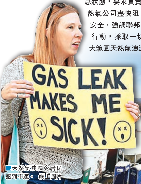
天然氣洩漏令居民感到不適。網上圖片

美國加州洛杉磯西北面的波特牧場住宅區，去年10月底發生天然氣儲存庫地下管道洩漏事故，至今持續2個多月仍未修復，數千名居民被迫搬遷，部分人疑受天然氣成分甲烷影響，出現頭痛及流鼻血等症狀。鑑於事態有惡化跡象，州長布朗前日宣佈當地進入緊急狀態，要求負責管理儲氣庫的南加州天然氣公司盡快阻止洩漏，確保公共健康安全，強調聯邦、州和地方當局需聯手行動，採取一切可行措施，盡快阻止大範圍天然氣洩漏。