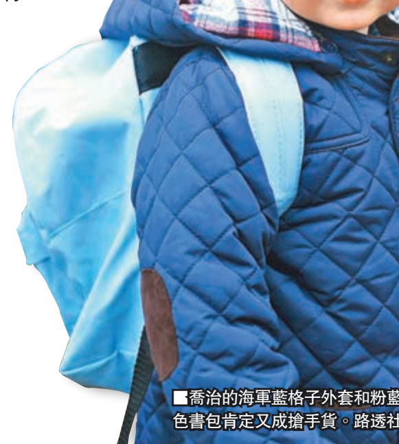
喬治的海軍藍格子外套和粉藍色書包肯定又成搶手貨。

英國喬治小王子前日開始上幼兒園，並由爸爸威廉王子及媽媽凱特王妃陪同上學。王室公開由凱特拍攝的兩張照片，相中小王子身穿海軍藍格子外套，背着粉藍色書包，其中一張他神情略顯緊張，另一張則好奇地指着幼兒園外牆壁畫。