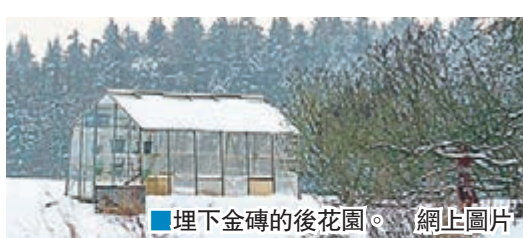
埋下金磚的後花園。

德國巴伐利亞一名69歲醫生，為了向前妻隱瞞身家，早前與朋友協定，在對方寓所後花園埋下價值200萬歐元(約1,683萬港元)的金磚。不過去年朋友離世後，他掘出金磚，卻遭朋友家屬告上法庭，引發爭產戰。法庭下令他必須證明金磚的擁有權，否則全數歸朋友家屬所有。