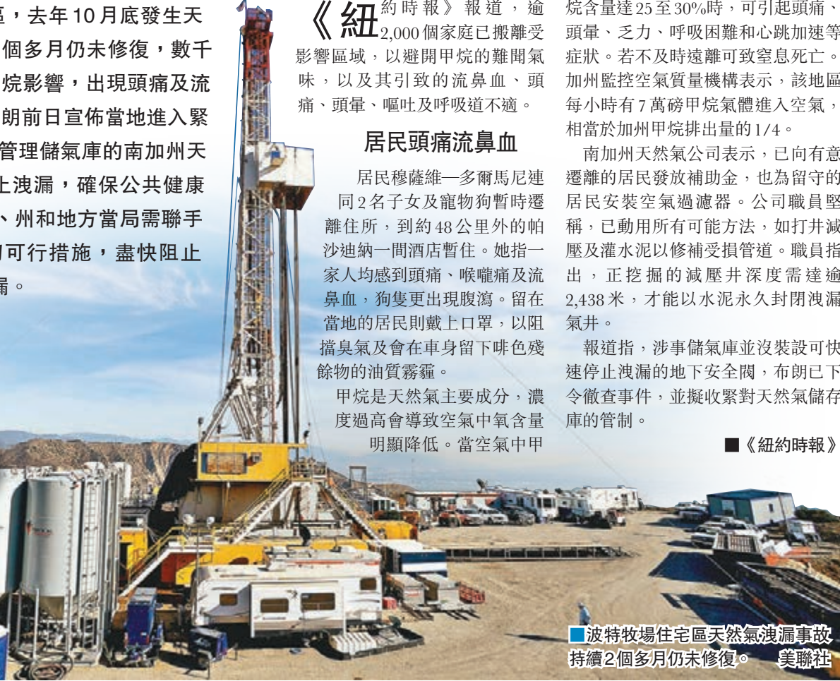
波特牧場住宅區天然氣洩漏事故持續2個多月仍未修復。

《紐約時報》報道，逾2,000個家庭已搬離受影響區域，以避開甲烷的難聞氣味，以及其引致的流鼻血、頭痛、頭暈、嘔吐及呼吸道不適。