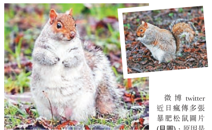
微博Twitter近日瘋傳多張暴肥松鼠圖片(見圖)，原因是英國經歷不尋常暖冬，12月平均氣溫達攝氏7.9度，較歷年平均溫度高出4.1度。專家指，暖冬令松鼠主食如堅果、種子等增多，而不會冬眠的松鼠習慣在嚴寒冬天來臨前，多吃來儲存脂肪保暖，加上松鼠身上毛皮變厚，身形看上去便似乎較以往更龐大，於是出現大量肥松鼠。