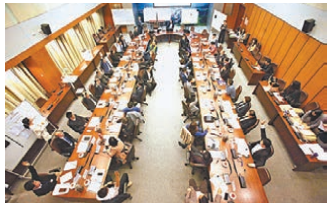
沙田區議會會議現場。

其後以投票決定是否加插質詢環節，結果贊成及反對同為19票，報稱獨立的蕭顯航投棄權票，何麗嫦最後決定讓候選人用4分鐘簡介政綱，另外4分鐘容許議員提問及候選人回答，但候選人可以不回答。