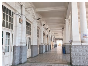
火車站內的建築設計