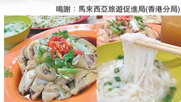
鳴謝：馬來西亞旅遊促進局(香港分局)