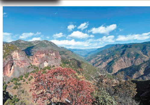
群峰競秀 丹霞勝境老君山 ■ 雲南麗江老君山國家公園景色。