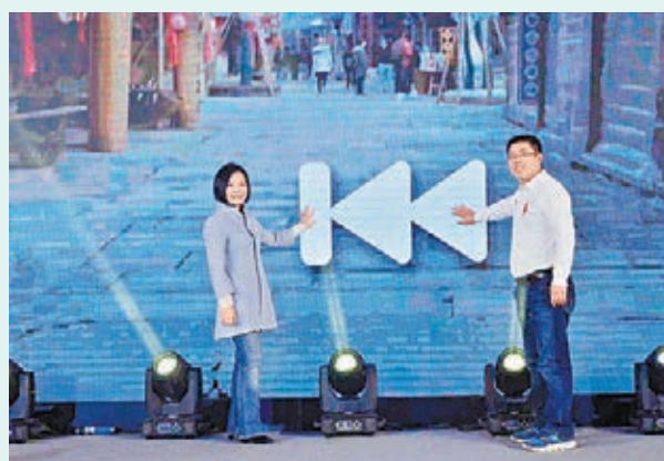
■ 烏鎮旅遊股份有限公司、北京古北水鎮旅遊有限公司代表與高德地圖代表啓動合作儀式。

服務需求，是極需解決的難題。作為南北兩個著名水鎮，烏鎮、古北水鎮景區近日聯合高德地圖大力發展智慧旅遊，為景區遊客提供精準的步行導航、明星語音導遊、一鍵找點位、獲取活動實時信息等智慧服務，同時為景區管理提供雲圖管理、熱力圖、人流分析與調度等功能，幫助景區管理者及時、高效地解決景區資源調度問題，消除此前遊客在景區容易遇到的迷路、擁堵、排隊、信息滯後等煩惱。高德集團產品副總裁陳永海稱，除了烏鎮、古北水鎮外，高德亦與多家全國知名景區達成智慧景區合作協議，下一步將在全國各大景區拓展這一服務，向遊客推出更多更智慧、更智慧的景區服務。