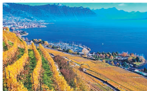
瑞士拉沃之秋 ■ 在瑞士西部拉沃地區拍攝的梯田式葡萄園秋景。