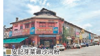
安記芽菜雞沙河粉

在怡保，你不愁沒有好東西吃，怡保確是「美食天堂」，例如擁有超過40年歷史的安記，店家堅持以最簡單的方法烹調，不下太多調料，菜餚因此更具原味。招牌菜芽菜雞，肉質嫩滑，以雞骨湯焗，加上豉