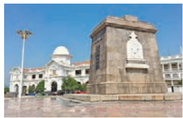
紀念死亡鐵路之死者之碑。

走進了這座充滿藝術氣息的城市，在位於老城區近打河以西的怡保舊城，是相對早期的採礦小鎮，在這裡，你可以看到許多老式建築，如怡保火車站、市政廳便是這兒的著名景點，其中的火車站更是殖民時期留下的老建築，白色的外表具有獨特的風格。