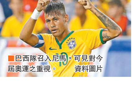
巴西隊召入尼馬，可見對今屆奧運之重視。資料圖片

西班牙《馬卡報》引述消息透露，西甲巴塞羅那超級前鋒尼馬，意圖國際米蘭後衛祖奧蘭達和巴甲國際體育會門將艾利臣，會以超過23歲的奧運「超齡球員」身份，代表巴西奧運隊在自己地頭衝擊里約熱內盧奧運男足金牌。「森巴軍」雖五奪世界盃冠軍，但奧足金牌卻一次未得，而奧足賽會容許各參賽球隊選入最多3名23歲以上的「超齡球員」。