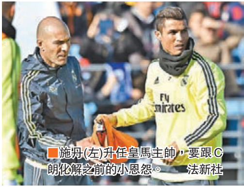
施丹(左)升任皇馬主帥，要跟C朗化解之前的小恩怨。

賓尼迪斯因鎮不住皇家馬德里更衣室兼對同級強隊績差被炒，施丹日前接任主帥後立即着手處理球員關係，還向加里夫巴利強調，「BBC」鋒線組合一個都不能少。施丹曾3次當選世界足球先生，也曾效力皇馬。他之前只帶領過皇馬B隊參加西班牙丙組第二組別聯賽，不過今年44歲的法國前球王揚言，儘管艱難仍會全力帶領「銀河戰艦」重展銳利的進攻足球魅力。2014年皇馬奪得歐聯及西班牙盃雙冠的球季，施丹就是以前助教身份輔助去年被