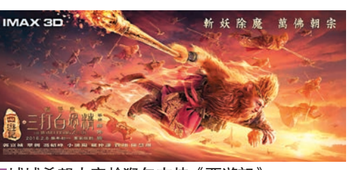
城城希望大家趁猴年支持《西遊記》。

城城事後表示：「我今次做孫悟空是傾盡心力去演出，舞功混合武功，全力以赴，希望大家看到一個不一樣的孫悟空，加上導演和所有演員團隊的齊心打造，我們對電影本身當然有信心，加上今年是猴年，希望大家都會支持《西遊記》，令電影得到好成績。但我希望所有賀歲電影，大家都有好的票房，百花齊放。」