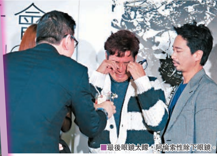
最後眼鏡太濇，阿倫索性除下眼鏡。