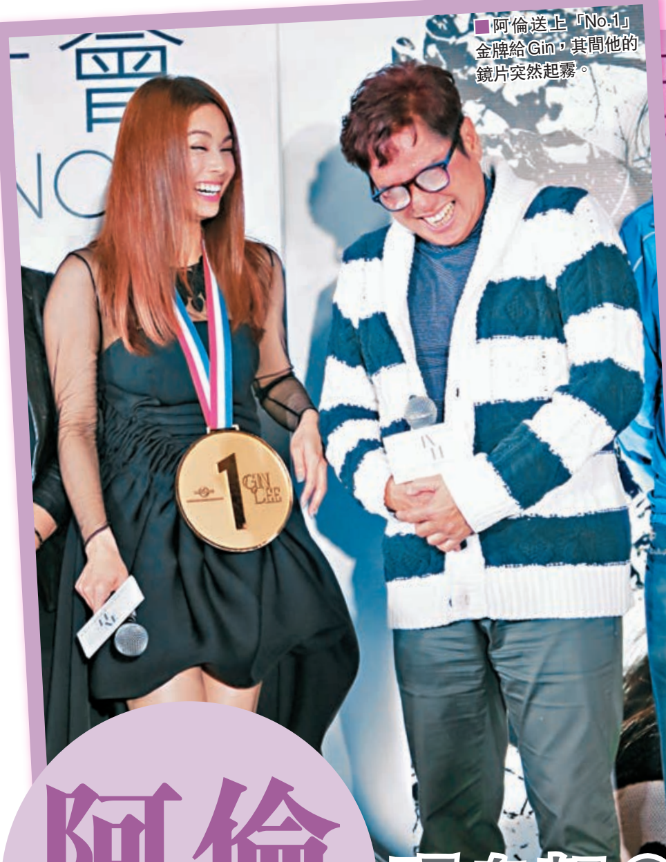
阿倫送上「No.1」金牌給Gin，其間他的鏡片突然起霧。