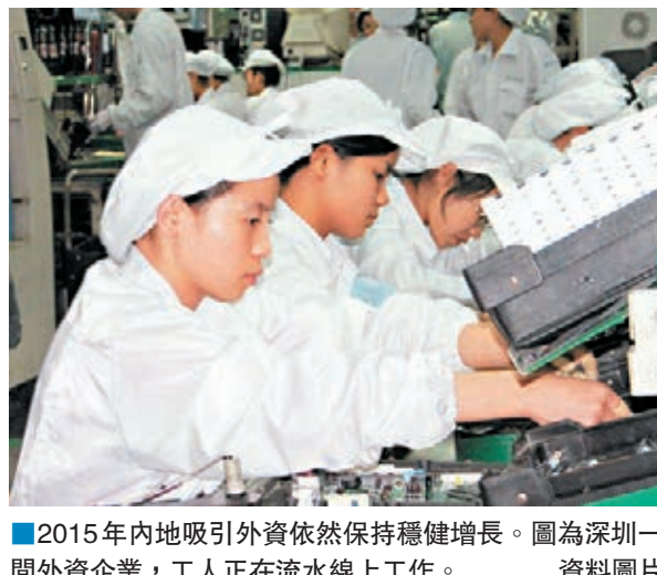
■2015年內地吸引外資依然保持穩健增長。圖為深圳一間外資企業，工人正在流水線上工作。

香港文匯報訊（記者 馬琳 北京報道）儘管全球經濟低迷、投資放緩，但2015年內地吸引外資依然保持穩健增長。商務部昨日發佈數據顯示，預計2015年內地吸收外資規模可達1,260億美元（約合港幣9,767億元），再創歷史新高。