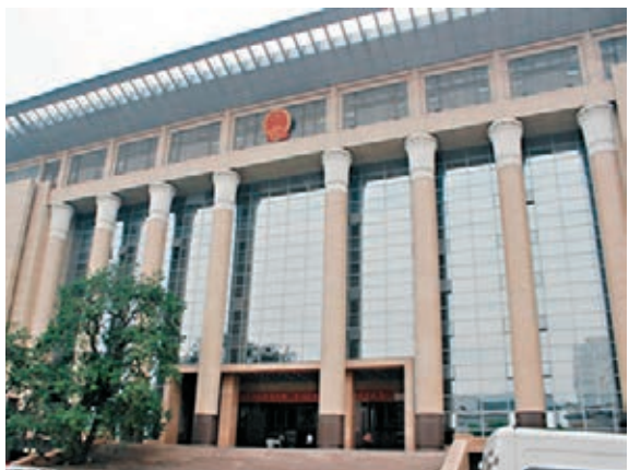
■最高人民法院對於失信被执行人的懲戒力度不斷加大。圖為最高人民法院外觀。

香港文匯報訊（記者 葛沖 北京報道）最高人民法院審判委員會副級專職委員、執行局局長劉貴祥昨日在北京透露，今年一季度，以最高人民法院執行查控體系為核心，以地方各級法院執行查控體系為補充、覆蓋內地以及所有基本財產形式的執行查控體系即將完成，這將對被執行人財產「一網打盡」，對失信被執行人形成多部門、多領域的聯合信用懲戒。