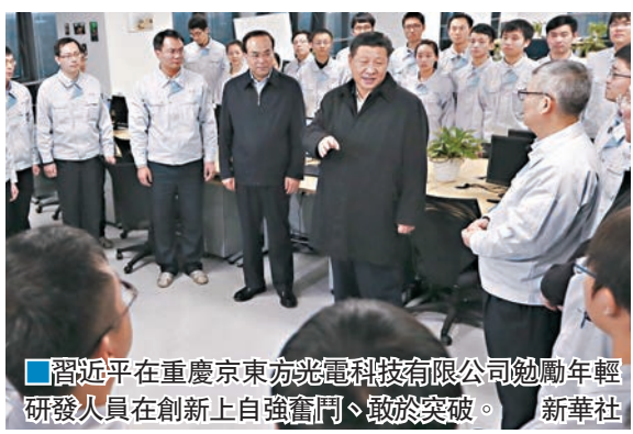
■習近平在重慶京東方光電科技有限公司勉勵年輕研發人員在創新上自強奮鬥、敢於突破。

習近平指出，今年仍然是全面深化改革具有關鍵意義的一年，要把具有標誌性、引領性、支柱性的改革任務牢牢抓在手上，主動出擊、貼身緊逼、精準發力。地方抓改革、推改革，一方面要落實好黨中央部署的改革任務，一方面要搞好探索創新。要在堅持全國一盤棋的前提下，確定好改革重點、路徑、次序、方法，創造性落實好中央精神，使改革更加精準地對接發展所需、基層所盼、民心所向。要吃透中央制定的重點改革方案，同時完善落實機制，從實際出發、從具體問題入手，見物見人，什麼問題突出就著重解決什麼問題，使改革落地生根。