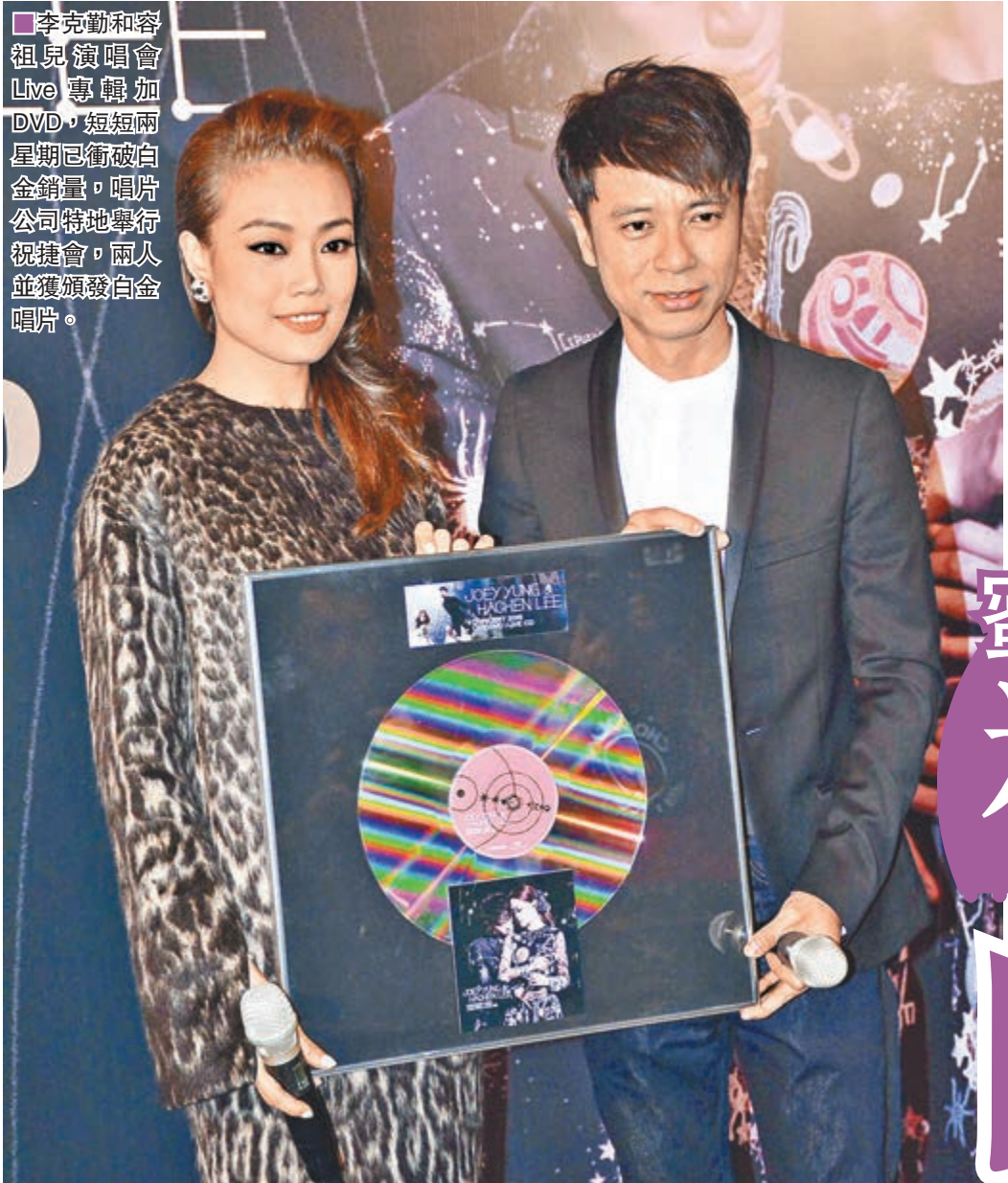
李克勤和容祖兒演唱會Live專輯加DVD，短短兩星期已衝破白金銷量，唱片公司特地舉行祝捷會，兩人並獲頒發白金唱片。