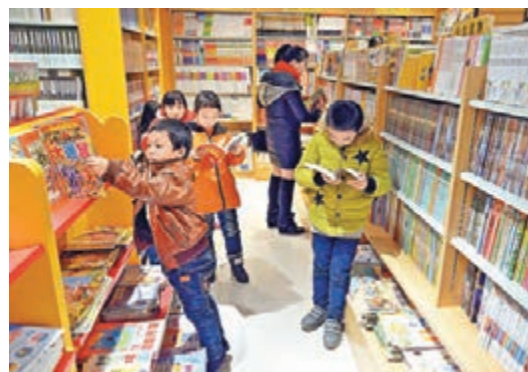
多閱讀才能學好中文，若從閱讀中找到樂趣，閱讀就不再是苦事了。