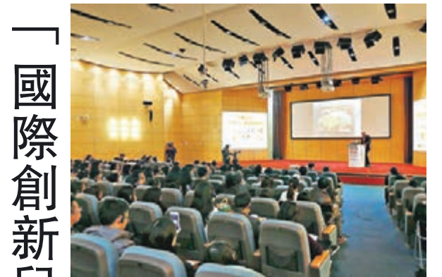
■「第三屆國際創新兒童藝術教育論壇」現場情況。

由蕃茄田藝術和華東師範大學設計學院聯合主辦的「第三屆國際創新兒童藝術教育論壇」前日在上海隆重開幕。論壇主題為「教學·創作——當代兒童藝術教育的同步建構」。來自中、美、英、法、澳等眾多海內外藝術教育界的專家學者匯聚一堂，分享藝術教育前沿的探索和研究，共同探討藝術教育的新未來。此次論壇一方面聚焦於「藝術教學方法與教學現場」，另一方面引入創新藝術教育工作坊，讓與會者能親身參與自身的教學經驗，與國際專家進行充分的實地交流。