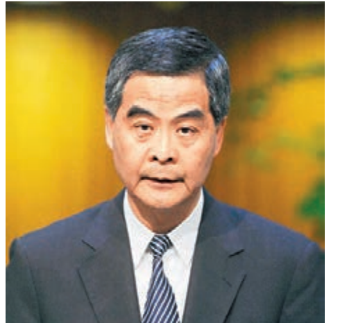
梁振英昨表示,特區政府於過去數日與各個不同方面連繫取得相關資料。

香港文匯報訊(記者 李自明)針對香港「銅鑼灣書店」股東及主管報稱「失蹤」案件,特區行政長官梁振英昨日表示,特區政府非常重視事件,並於過去數日與各個不同方面連繫取得相關資料,又強調當局會盡最大努力調查,但現階段不能公佈與案件有關情況,避免妨礙偵破工作。他又呼籲,有關人士,尤其是曾與其妻子聯絡的「銅鑼灣書店」股東之一李波,能夠接觸警方提供線索,讓警方盡快掌握線索,把案件關鍵情節拼湊起來。