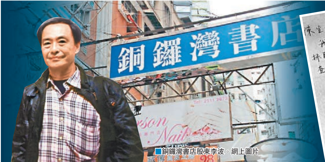
銅鑼灣書店股東李波。