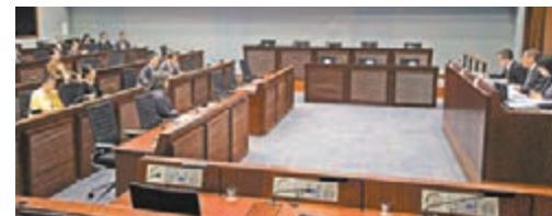
立法會保安事務委員會上,7名反對派議員要求臨時增加議程,討論李波事件。

同日,立法會主席曾鈺成不批准工黨主席李卓人提出,在今日立法會大會上就「失蹤」事件提出緊急質詢。覆函指,曾鈺成在考慮提出緊急質詢的理據和內容後,認為質詢與公眾有重大關係,但並不符合性質急切的條件,有關質詢於日後的立法會會議上提出亦不會失卻意義。