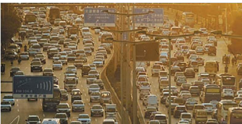
人口急速增長會對內地各方面的資源造成沉重壓力，包括基建、能源、糧食等，因此催生了一孩政策。資料圖片

從生態環境角度而言，中國目前「只有」13億人口，已經導致嚴重污染問題，部分地方亦出現過度開發。顯然，在教育制度尚未完善，公民質素仍未改善的情況下貿然開放生育政策，只會加劇生態環境破壞。故此，以往實施「一孩政策」限制人口，亦是考慮環境資源的承載能力，例如間接減少固體廢物量，減少土地污染。