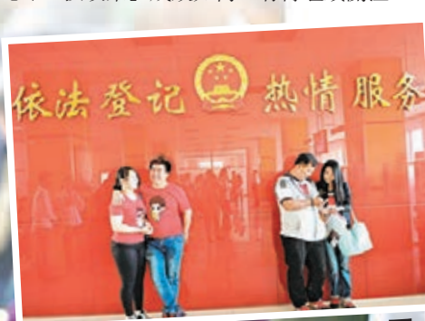
內地男多女少，性別失衡。圖為山東一婚姻登記處。資料圖片