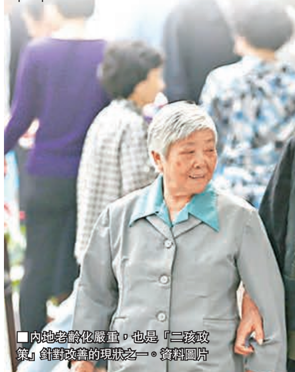
內地老齡化嚴重，也是「二孩政策」針對改善的現狀之一。資料圖片

「二孩政策」正是針對人口結構衍生出來，值得留意的是，2013年實施「單獨二孩」政策時效果欠佳，不少家庭礙於經濟、個人或社會考慮，拒絕生育，因此「二孩政策」成效如何，有待繼續關注。