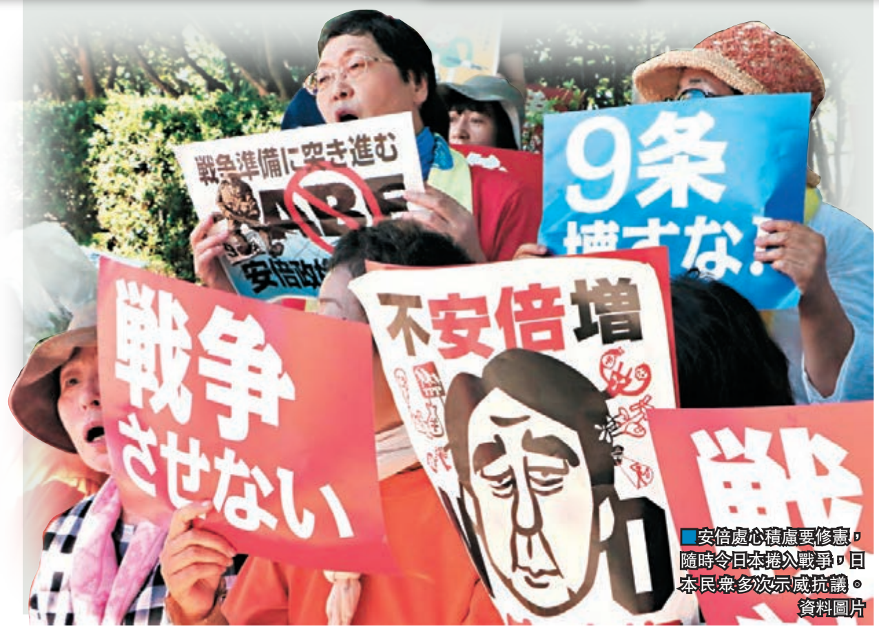
■安倍處心積慮要修憲，隨時令日本捲入戰爭，日本民眾多次示威抗議。資料圖片

由於參議員任期固定，假如安倍今次失敗，他未來3年便不可能修憲，直至下次參院改選為止。在野黨明白今次選舉的重要性，民主黨及維新黨已達成合作協議，團結力量與執政自民黨抗衡，據悉共產黨亦有意加入聯盟。 外交方面，安倍稱願意與俄羅斯解決北方四島(俄稱南千島群島)的主權問題，會尋求合適時間邀請俄總統普京訪日，舉行峰會討論北方四島及反恐事務，並推動兩國正式就二戰簽訂和約。安倍昨日出席眾院全體會議時，提到日本和韓國早前達成的慰安婦協議，形容問題已獲終極解決，日韓關係將進入「新時代」。國會門外則有示威者抗議，反對安倍修憲的主張。 ■共同社/美聯社/法新社