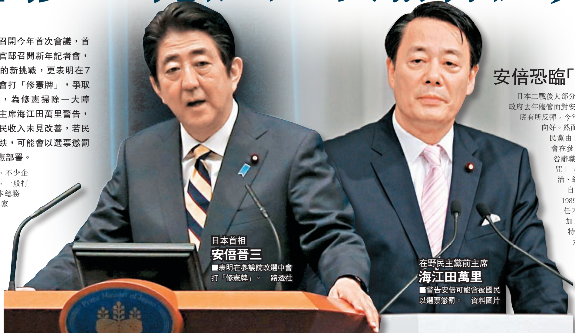
日本首相 安倍晉三 ■表明在參議院改選中會打「修憲牌」。

日圓近年大幅貶值，不少企業收益有所增長，一般打工仔卻未能受惠。日本總務省調查顯示，日本勞工家庭實質收入連續29個月下跌，去年企業年終獎金按年減少2.4%。安倍昨日再次表示，會努力實現「一億總活躍社會」，解決人口老化等問題，但環球經濟未見改善，日本難以獨善其身，假如勞工收入持續下降，國民不滿勢必升溫。