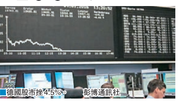
■美聯社/路透社/法新社/《衛報》/《華爾街日報》

分析指出，美國股市、新興市場及垃圾債券市場去年表現令人失望，大部分投資者不看好後市，認為部分市場在多年升市後今年將回落。富達投資策略師蒂默指，大宗商品價格低迷、經濟放緩等因素或持續拖累新興市場。