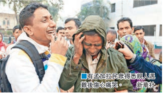
有孟加拉民衆得悉親人遇難後傷心痛哭。