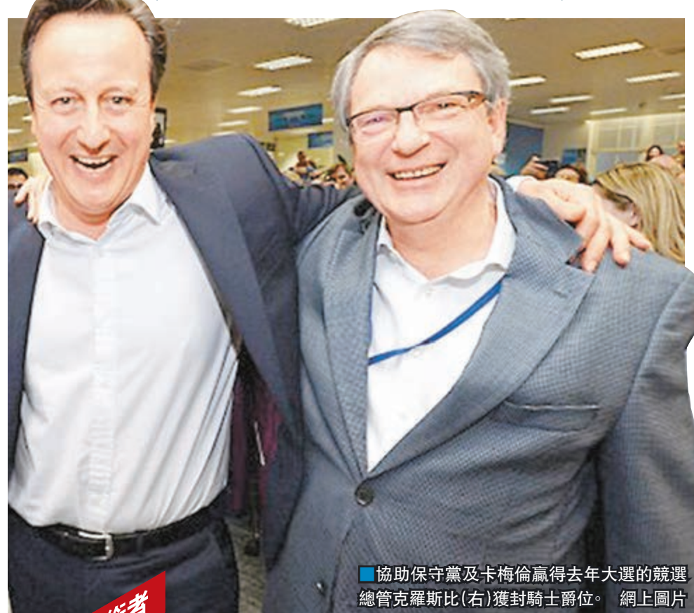
協助保守黨及卡梅倫贏得去年大選的競選總管克羅斯比(右)獲封騎士爵位。

英女王伊利沙伯二世公佈新年授勳名單，執政保守黨金主及多名陷入醜聞或表現平庸的官員名列榜上，引起爭議。在野工黨批評首相卡梅倫向朋友「派發」勳銜，形容是「最惡劣的裙帶關係」，令授勳制度蒙羞。協助保守黨贏得去年5月大選的澳洲籍競選總管克羅斯比獲封騎士爵位，更被工黨議員狠批是侮辱，反映保守黨為所欲為。