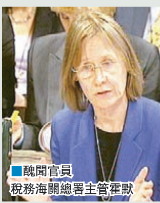
醜聞官員 稅務海關總署主管霍默