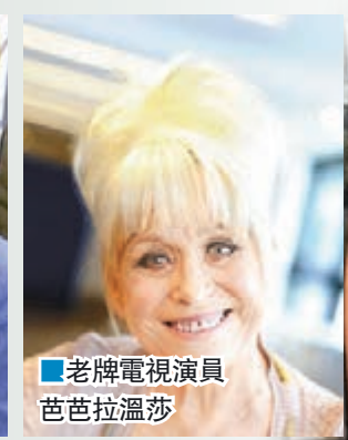
老牌電視演員 芭芭拉溫莎