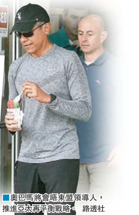
奧巴馬將會晤東盟領導人，推進亞太再平衡戰略。