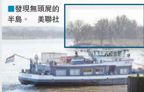
發現無頭屍的半島。

領土糾紛很多時會引致國家之間大動干戈，不過比利時與荷蘭正着手互換邊境地區一小塊領土，原因竟與一具無頭屍體有關。比利時東部城市維塞，坐落於分隔比荷的默茲河附近，轄下包括一個約15個足球場大、三面環河、陸路僅與荷蘭相連的半島，當地3年前發現一具無頭屍，比利時調查人員打算調查時，發現要登陸半島極為困難，若繞路，又要向荷蘭申請，為免日後麻煩，決定處理完案件後便把半島割讓予荷蘭。