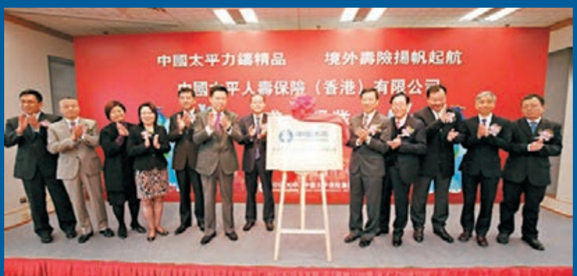
2015年12月22日，中國太平保險集團旗下中國太平人壽保險(香港)有限公司正式開業。

中國太平保險集團旗下香港壽險子公司——中國太平人壽保險(香港)有限公司(簡稱「太壽香港」)於12月22日在集團總部舉行開業儀式，宣告公司正式開業。當天下午，太壽香港即在公司VIP簽單中心順利開出首張保單，這是中國太平「精品戰略」時期境外壽險的第一單，標誌着中國太平海外壽險戰略取得了重大突破。