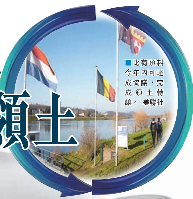
比荷預料今年內可達成協議，完成領土轉讓。