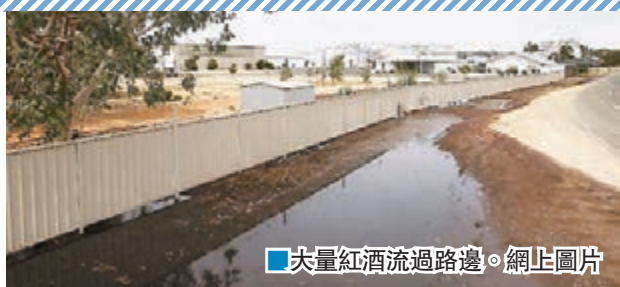
大量紅酒流過路邊。