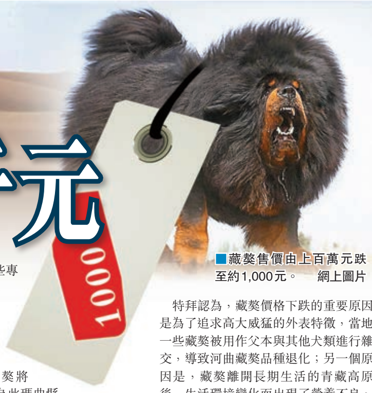
■藏獒售價由上百萬元跌至約1,000元。

2010年以後，「藏獒熱」開始降溫。在瑪曲縣城和農牧區，大量藏獒養殖場近幾年紛紛倒閉，藏獒集市、攤點已經難覓蹤影。瑪曲縣城目前僅存兩三家養殖園。