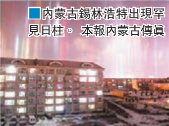
■內蒙古錫林浩特出現罕見日柱。

內蒙古錫林浩特2015年12月30日晚間出現日柱現象，網友驚呼：「七仙女下凡了！」