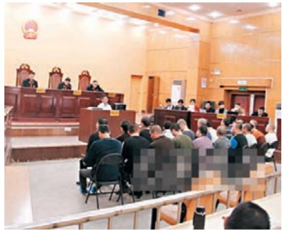
■湛江黑幫21名被告被控八宗罪。圖為庭審場景。