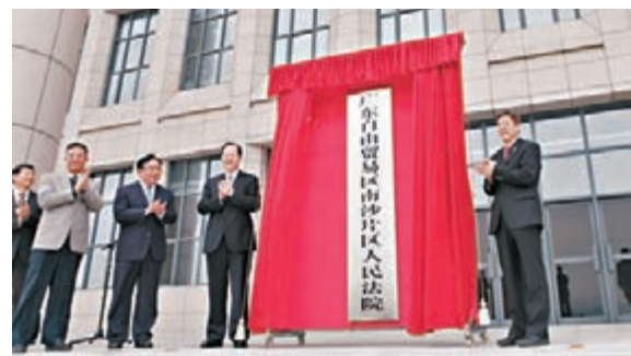
■廣州南沙自貿區法院前日掛牌成立。本報廣州傳真

香港文匯報訊(記者古寧廣州報導)內地首家自貿區法院、廣東自由貿易區南沙片區法院前日在廣州南沙揭牌成立。記者當天也了解到,未來南沙自貿區法院將在港籍人民陪審員參與案件審理機制等方面繼續作出探索。