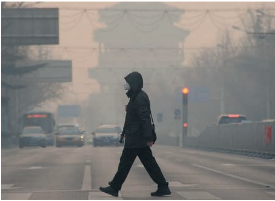
►有關信息顯示,張力軍任內未將汽車污染納入污染控制總量。圖為行人在霧霾籠罩的北京街頭。

被稱為環保領域「首虎」的張力軍於今年7月底被宣佈接受調查,此時距他從環保部副部長上退休已經兩年多。張曾在環保部分管污染控制司、環境監察局、污染物排放總量控制司等要害部門多年,此次被控利用職務便利為親屬、他人謀取利益並受賄,且在十八大後仍不收敛、不收手。