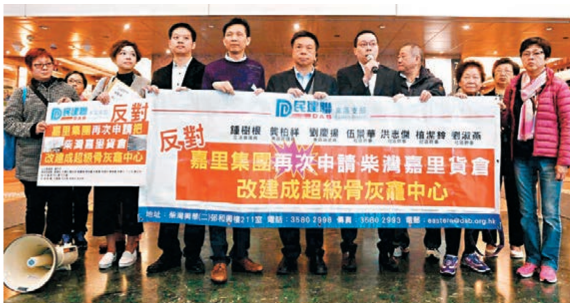
民建聯等多個團體分別向城規會請願，反對柴灣嘉里貨倉改建骨灰龕。