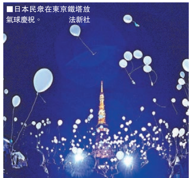
■日本民眾在東京鐵塔放氣球慶祝。法新社

■法新社/美聯社/路透社/美國有線新聞網絡/《每日郵報》/《每日電訊報》/《新西蘭先驅報》