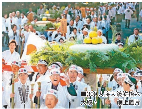
■300人將大鏡餅抬入大殿。