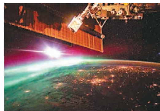
■美國太空人10月在太空站拍到地球上的北極光。