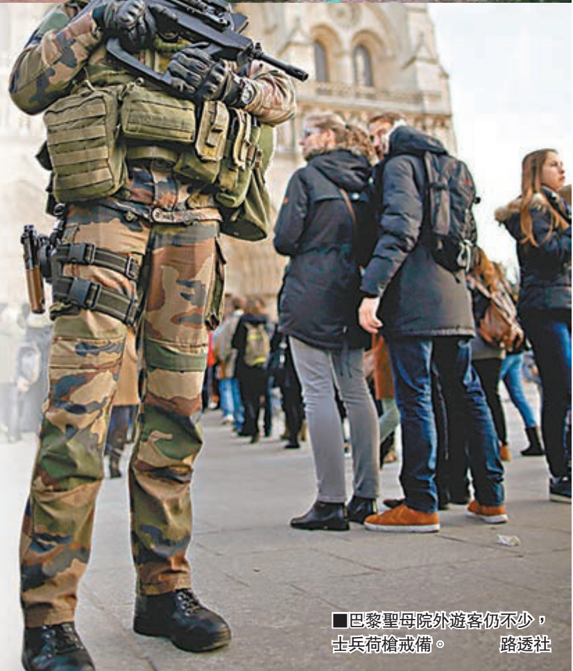
■巴黎聖母院外遊客仍不少，士兵荷槍戒備。