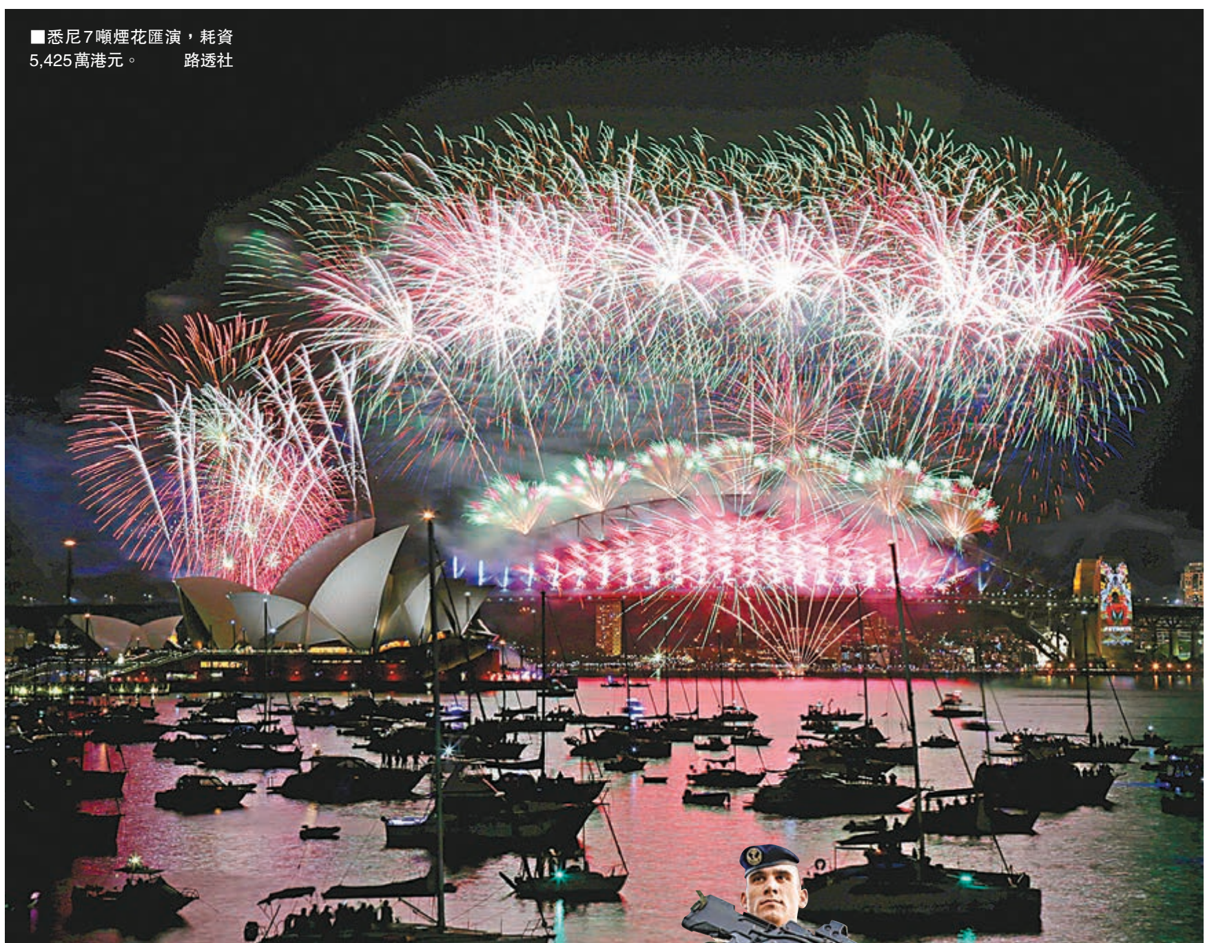
■悉尼7噸煙花匯演，耗資5,425萬港元。