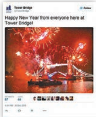
■塔橋twitter官方賬戶早一天發佈賀年照。