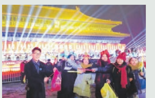
民眾在太廟前合影留念。

隨着「10、9、8、7、6、5、4、3、2、1」的歡呼聲,2016的新年鐘聲在夜空中敲響,神聖莊嚴的太廟頓時金光萬丈,無數「福」字圍繞在每一個人的身邊。現場遊客紛紛熱情擁擠,彼此祝福,祝福北京更加美好。