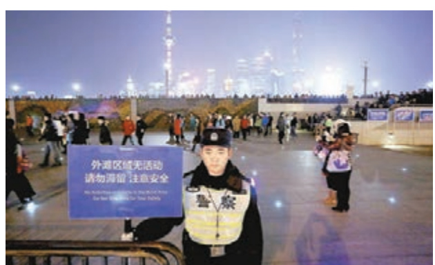
為確保跨年安全,上海警方昨日全員上崗,引導人流。

他承諾,中國將永遠向世界敞開懷抱,也將盡己所能向面臨困境的人們伸出援手,「讓我們的「朋友圈」越來越大」。