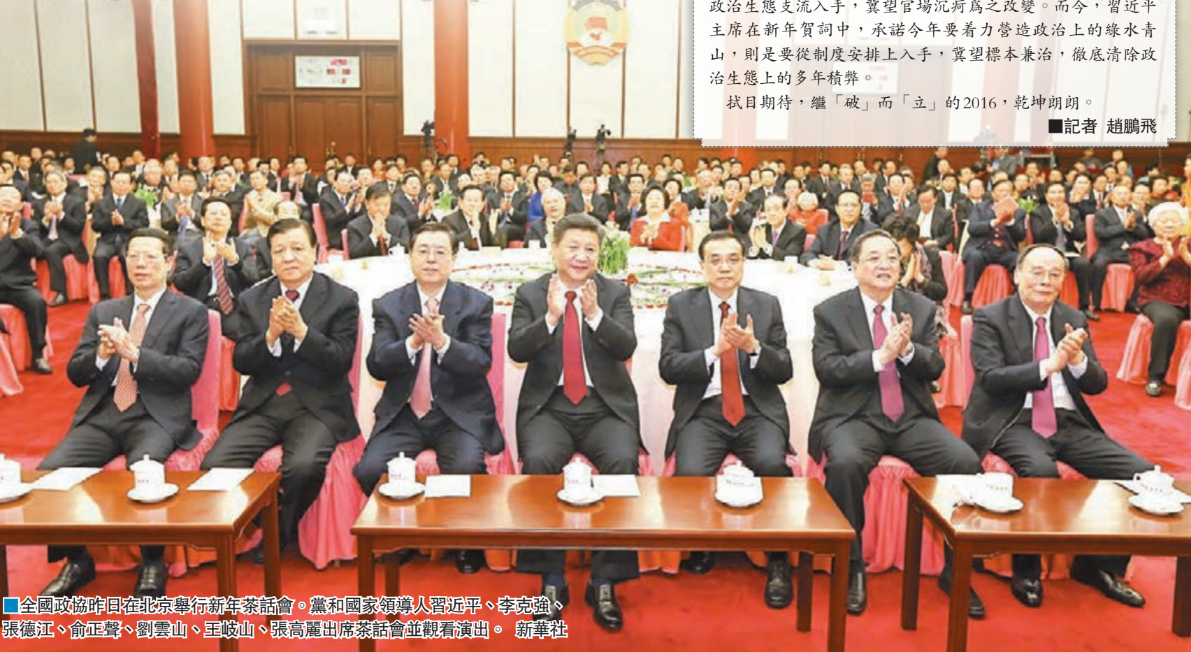
全國政協昨日在北京舉行新年茶話會。黨和國家領導人習近平、李克強、張德江、俞正聲、劉雲山、王岐山、張高麗出席茶話會並觀看演出。