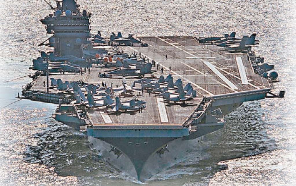
■「杜魯門」號途經霍爾木茲海峽時，伊朗革命衛隊在航母附近海域試射火箭。