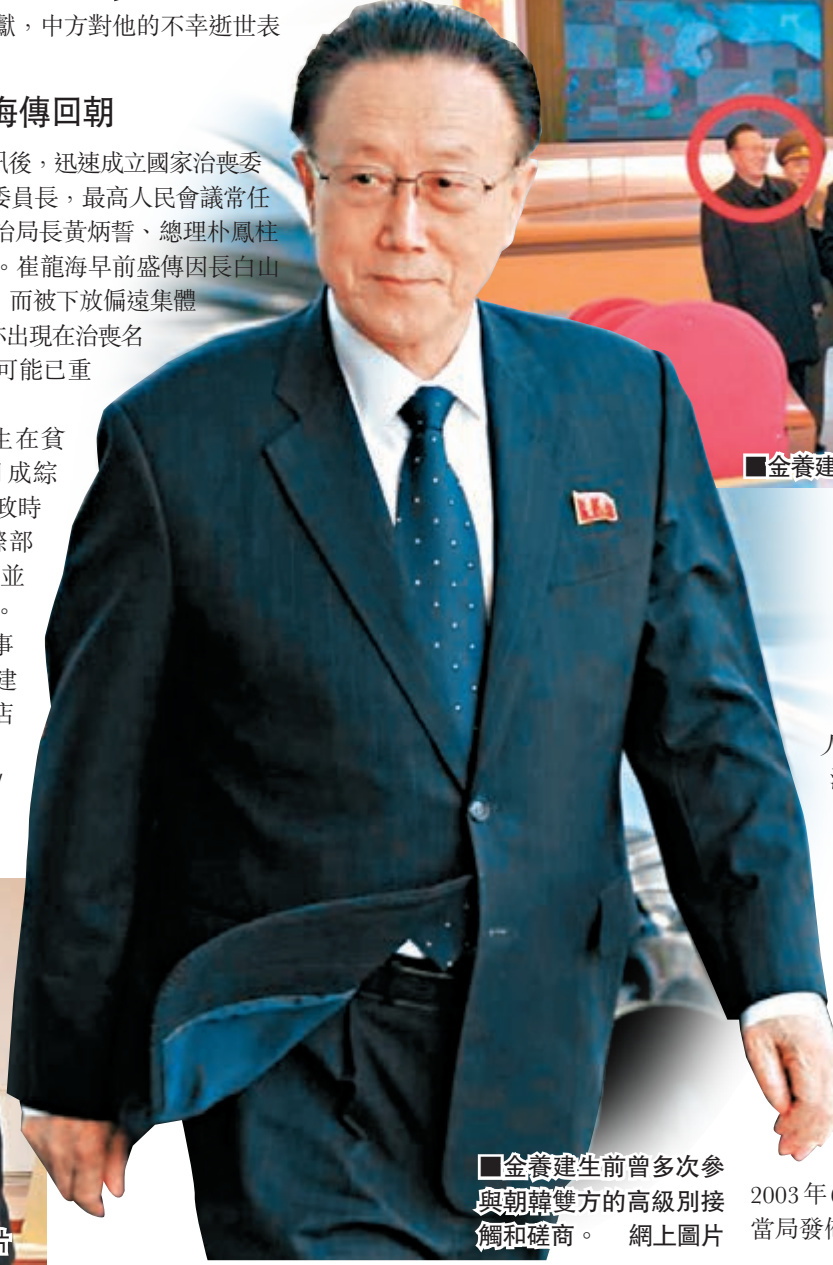
■金養建生前曾多次參與朝鮮雙方的高級別接觸和磋商。