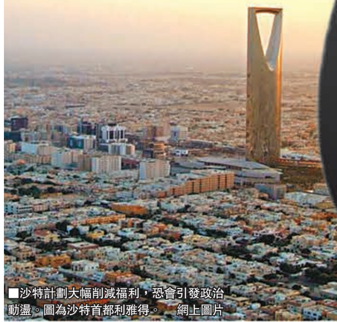
沙特計劃大幅削減福利，恐會引發政治動盪。圖為沙特首都利雅得。