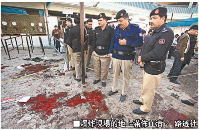
爆炸現場的地上滿佈血漬。