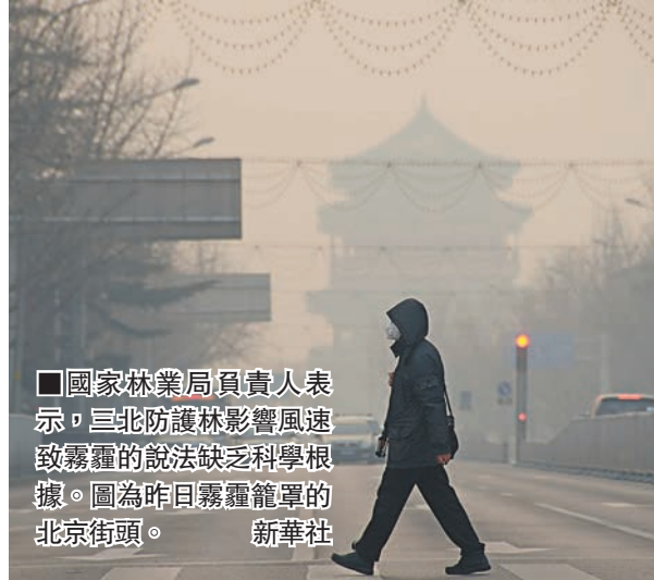
國家林業局負責人表示，三北防護林影響風速致霧霾的說法缺乏科學根據。圖為昨日霧霾籠罩的北京街頭。

香港文匯報訊（記者 王珏 北京報道）今冬北京霧霾肆虐，對於近期霧霾嚴重、風減少是否與三北防護林有關，國家林業局負責人昨天表示，三北防護林影響了風速，於是有了霧霾，這一說法缺乏科學根據。他稱，北京周邊造林肯定有降低風速的作用，但降低有限的，不可能改變大氣環流，且植樹造林不僅不會造成霧霾，還有助於霧霾治理。