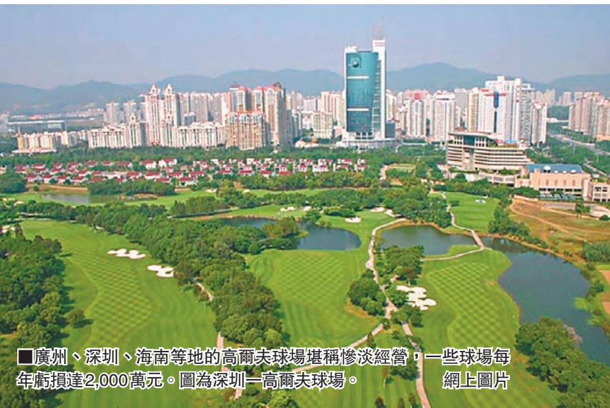
廣州、深圳、海南等地的高爾夫球場堪稱慘淡經營，一些球場每年虧損達2,000萬元。圖為深圳一高爾夫球場。

鄒斌還表示，海南各球場運營成本基本在每年1,000萬至1,500萬元，營業稅及各項附加高達23%。當年，海南對高爾夫行業徵收20%的高額稅負，表明政府對高爾夫行業的態度，希望控制高爾夫球場的數量。