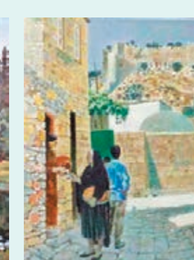
穆薩耶夫《傑爾賓特》