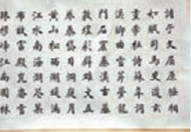
書法作品(作者：蕭允中)

《赤壁懷古》和《遊山西村》；楷書四條屏《把酒問月》、《歸園田居》、《滿江紅》等；還有充滿時代氣息的毛澤東《詠梅》、《矛盾語錄》等。國畫有《仿王時敏筆意》、《不可一日無此君》。