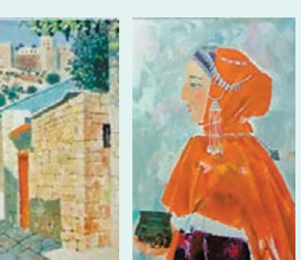
穆薩耶夫《少數民族女子》