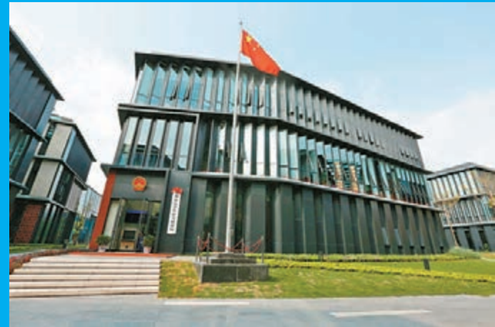
■深圳前海合作區人民法院

目前，前海蛇口自貿片區註冊企業總量實破6.9萬家，開業率為21%，今年1至10月已完成稅收152.96億元，已超過全年預計數132億元的15.88%，固定資產投資全年達300億元，其中，前海片區完成稅收81.77億元，同比增長213.36%，固定資產投資超過200億元，相當於前三年投資的總和。