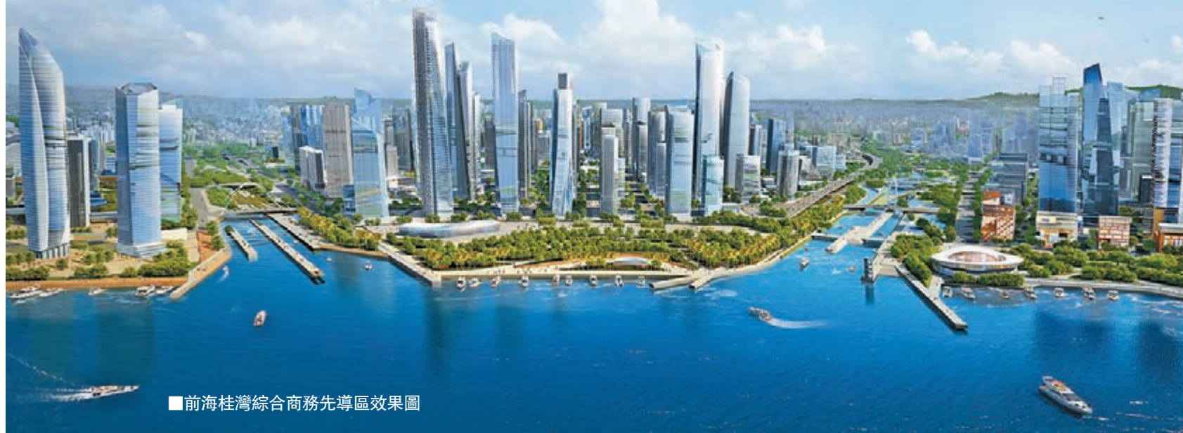
■前海桂灣綜合商務先導區效果圖

在深港合作方面，前海出台了促進深港合作工作方案2015年行動計劃，積極籌備發起前海香港產業聯盟商會，召開前海蛇口自貿片區諮詢委員會年度會議，增補8名委員，其中來自香港或從事港澳工作的成員3名；在法治方面，草擬前海深港現代服務業合作區社會主義法治建設示範區實施綱要，提出30項工作任務，向全國人大法工委和國務院法制辦領導進行匯報溝通，獲得支持。在人才方面，擬定前海蛇口自貿片區建設國際人才自由港工作方案，提出「六自由一保障」（即出入境居留自由、執業從業自由、創新創業自由、投資興業自由、智力交流自由、生活便利自由和人才法制保障）共七大方面38條具體任務。