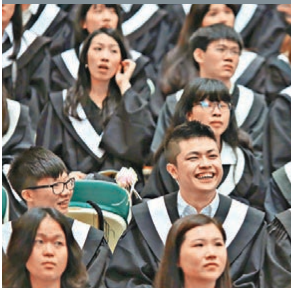
陸生赴台就讀「專升本」試點省份增至8個省份。圖為首屆大陸赴台就讀大學生畢業禮。 資料圖片

香港文匯報訊 自明年起，除廣東、福建外，陸生赴台就讀「專升本」(大學專科層次學生進入本科層次階段)試點省份將新增北京、上海等6省市，以上8省份的招生名額將由目前的1,000名增加至1,500名，大陸67所高職院校的應屆畢業生可以報考。