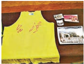
台灣省運動員當年穿過的球衣。