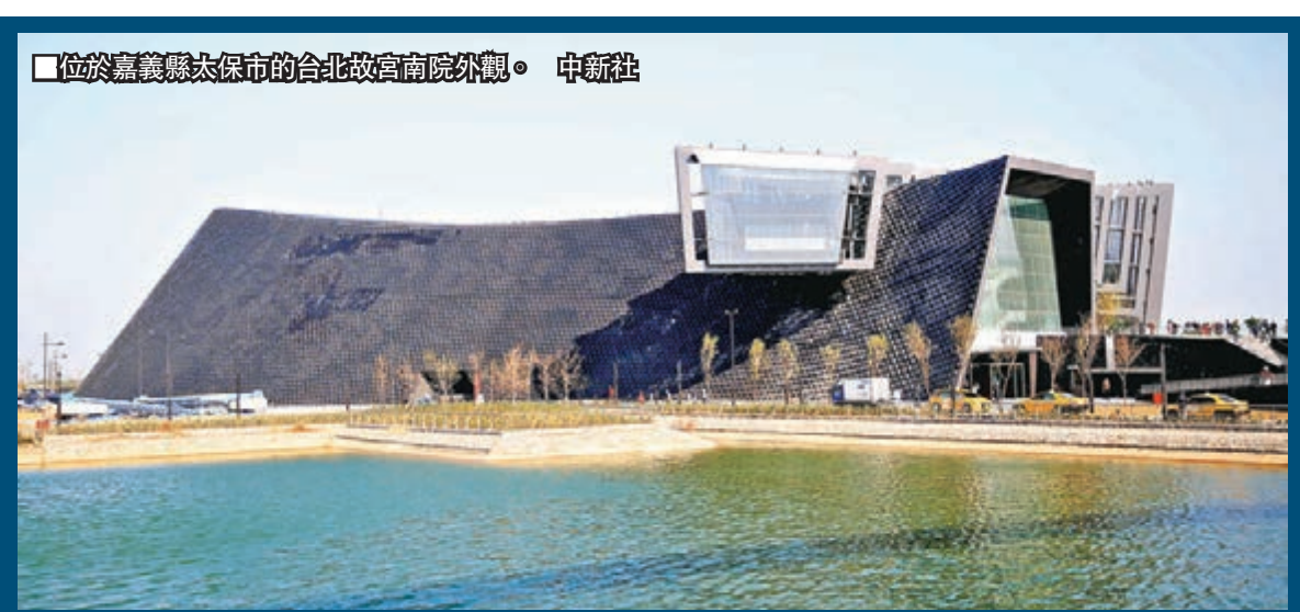
位於嘉義縣太保市的台北故宮南院外觀。