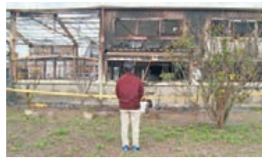
因現場封鎖不得進入，罹難者家屬在外駐足凝望殘破焦黑的鐵皮屋。

香港文匯報訊 台灣苗栗縣一間鐵皮屋27日凌晨發生大火，當時釀成7死4傷；其中一名情況危殆的24