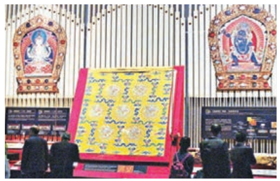
南院的十場展覽中，珍貴的《龍藏經》不能錯過。

為配合嘉義地區盛產茶葉的特色，首展安排了「芳茗遠播—亞洲茶文化展」，集中展現故宮館藏的歷代茶器，以及日本和台灣的現代茶器。國際借展之一的「尚青—高麗青瓷特展」展出日本大阪市立東洋陶瓷美術館出借的近200件高麗青瓷，首次把北宋汝窯瓷器與深受北宋影響的朝鮮瓷器同台展出。