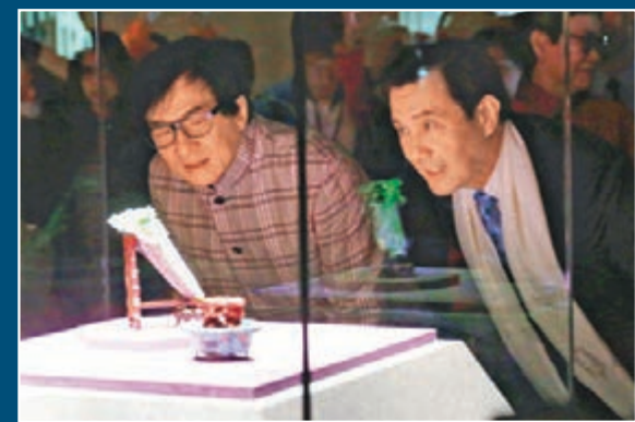
馬英九(右)、成龍(左)欣賞「翠玉白菜」。 中新社