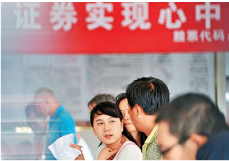
■內地股票發行註冊制自明年3月1日施行，期限為兩年。圖為山西太原市一間證券行。

核准制度相比，註冊制是一種更為市場化的股票發行制度，其主要內容是以信息披露為中心，完善信息披露規則，由證券交易所負責企業股票發行申請的註冊審核，報證監會註冊生效；股票發行時機、規模、價格等由市場參與各方自行決定，投資者對發行人的資產質量、投資價值自主判斷並承擔投資風險。監管部門重點對發行人信息披露的齊備性、一致性和可理解性進行監督，強化事中事後監管，嚴格處罰欺詐發行、信息披露違法違規等行為，切實維護市場秩序和投資者合法權益。