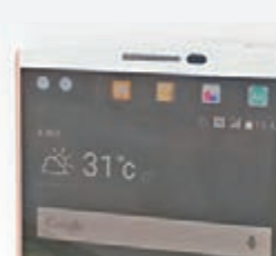
V10副螢幕位於上方，以及雙自拍鏡頭位於左上角位置。

LG全新V系列智能手機V10，以多項在流動設備上前所未有的多媒體功能，包括副螢幕、雙自拍鏡頭及自動攝錄模式，除了讓V10成為與眾不同的智能手機之外，更為廣大消費者帶來劃時代的智能流動體驗。而且，它更採用高級不銹鋼及獨有的合成物Dura Skin，使其成為市場上少數通過由獨立第三方進行的跌落測試。在主螢幕關閉時，用家可於副螢幕上設定顯示天氣、時間、日期及電量圖示；而在主螢幕啟動時，副螢幕將會搖身一變成專屬的應用程式快捷列表，讓用家快速啟動各種自定的喜愛應用程式。同時，當用家使用全屏享受電影或遊戲時，副螢幕亦會顯示來電及其他通知，完全不會阻擋主螢幕的畫面；用家可選擇不理會有關提示，或檢視有關訊息。