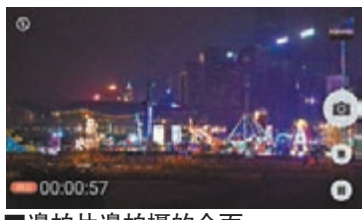
邊拍片邊拍攝的介面

期間才對焦到火光上，如在這樣難度高的情況下拍到一張不錯的煙花相片，相信會很有滿足感。同時，筆者亦分享一下自己拍