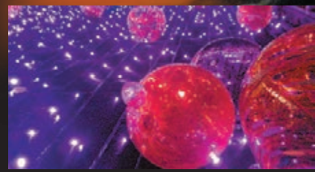
現在使用手機拍攝燈飾夜景，也可以很出色。