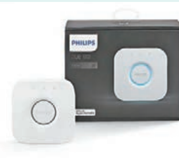
Philips Hue Bridge 2.0，售價：HK$498。

它還提供與Hue智能照明系列互動的新方法，把科幻小說描述的情境進一步推向現實。透過Siri聲控系統，你可以向家語說出指令：「Siri，燈光使用Energize模式。」把照明設定轉為精力充沛情境模式，讓你精神飽滿地迎接新一天；又或是簡單地說聲「海灘模式」，便可把家居的氛圍變得輕鬆寫意。