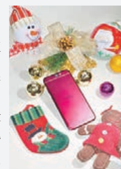
HTC One A9石榴紅版本

HTC自早前推出的One A9月石銀、碳晶灰及寶石金版後，深受用家喜愛，最近加推另一新色——石榴紅版本，A9擁有嶄新輕薄設計，以一體成形、瑰麗雙工藝處理技術，打造出7.26mm超輕薄金屬機身，備有5吋2.5D Corning Gorilla Glass極窄邊框全高清螢幕。它更配備1,300萬像素藍寶石水晶f/2.0廣角鏡，並加入第二代光學穩定技術(O.I.S.)，能有效迅速地修正拍攝時所產生的震動；配合前置HTC UltraPixel自拍相機，於低光環境下，也可拍攝出高質素的自拍照，將品牌高質、獨特的攝影技術發揮得淋漓盡致。同時，為照顧專業攝影家的需要，A9特設「Pro影像模式」，讓用家可以拍攝及編輯RAW相片，效果媲美電腦級專業軟件，並內置Hyperlapse動態縮時攝影模式，能讓你輕易拍出動感十足的動態縮時影片，並可因應需要調校至最高12倍播放速度，讓你感受更有趣的拍攝體驗，並隨時與好友分享。