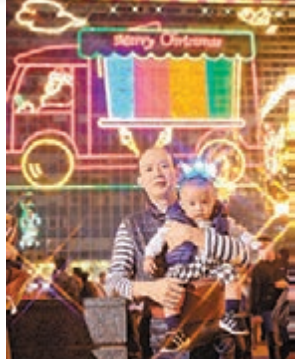
有補光下拍攝的人像與燈飾

在即將到來的除夕夜，又或這幾天的晚上，大家依然可以走到尖沙咀拍攝維港燈飾美景，甚至到各商場拍攝各種燈飾佈置，當然還可以在除夕夜拍下煙花美景。今期，專業攝影師許有達，其從事商業廣告攝影，屢獲攝影比賽獎項，曾拍攝不少燈飾及煙花的相片，他分享道，在佳節中到處都有美麗燈飾佈置，當拍攝人物在美景時，發現人總是黑黑的，假如用+/- 的曝光補償調光後，發現人物正常了，但景物則「曝光」，這是因為有光差，即使用相機拍攝也面對相同問題，但相機的閃光燈一定比手機強，那麼如何加多手機的閃光呢？手機的補光是固定輸出，要加強只好走近主體，但一走太近人物可能過大沒有美感。這時，假如手上有另一手機，則可叫另一朋友在附近幫忙打燈，一來加強了補光光量，二來用側光加強立體感。