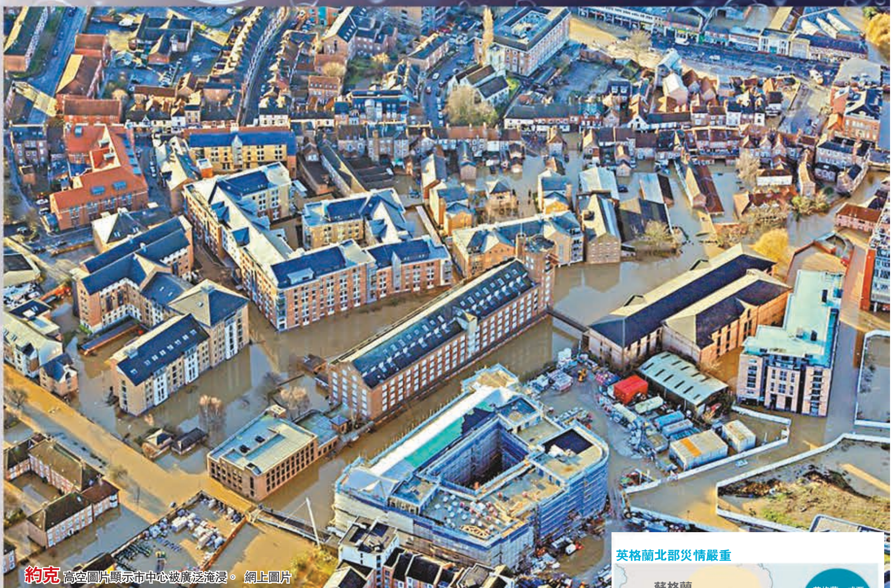
約克 高空圖片顯示市中心被廣泛淹浸。

今年厄爾尼諾現象強烈，全球多處聖誕期間天氣異常，北美東岸高溫破盡逾百年紀錄，美國中南部及南美則出現暴風雨。英國近日天氣惡劣，引發數十年來最嚴重水災，其中英格蘭北部蘭開夏郡及約克郡雨勢最大，利茲、洛奇代爾及曼徹斯特市郊等廣泛地區嚴重水浸，水位高達6呎。《星期日郵報》形容部分小鎮變成「小威尼斯」，數以千計居民無家可歸。IHS歐洲及英國總經濟師阿微表示，水災打擊商業及農業活動，可能令英國第四季國內生產總值(GDP)增長減慢0.1%至0.2%。