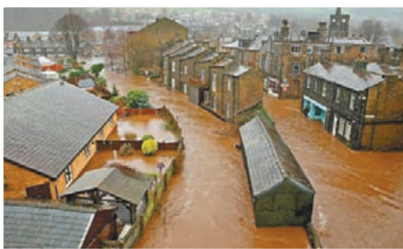
邁瑟姆羅伊德 洪水圍城