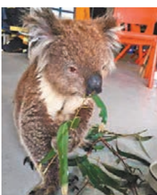
「熊警官」獲悉心照料，開懷大嚼。

英國大曼徹斯特區薩默西特是暴雨重災區之一，當地厄韋爾河河水暴漲，坐落厄韋爾河橋上、有200年歷史的酒吧Waterside被沖毀。有居民稱，Waterside部分建築正阻塞河流。外界認為，酒吧下的河水暴漲引致建築倒塌，而酒吧坐落的橋樑亦有倒塌之虞。 ■《星期日電訊報》