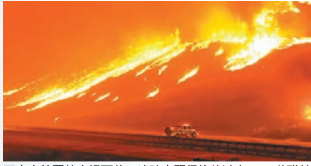
在大範圍的火場面前，消防車顯得格外渺小。