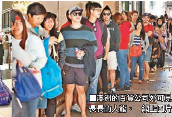
澳洲的百貨公司外可見長長的人龍。