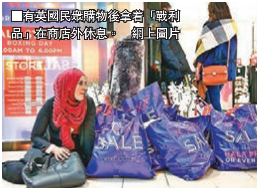
有英國民眾購物後拿着「戰利品」在商店外休息。