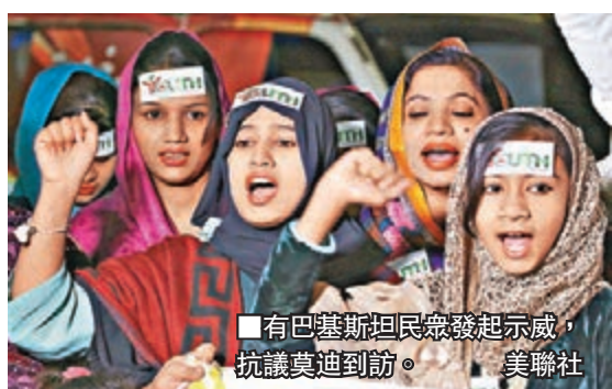
有巴基斯坦民眾發起示威，抗議莫迪到訪。美聯社

印度最大在野黨國民大會黨昨日批評莫迪事前未有徵詢國會，形容他在拉合爾的「茶敘」代價將是印度的國家安全；巴基斯坦反對派亦批評謝里夫先斬後