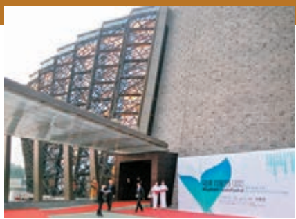
上演開幕節目的烏鎮大劇院