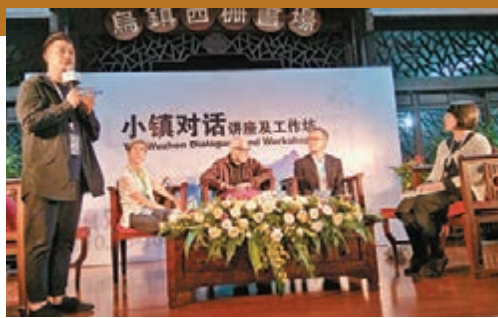
小鎮對話：經典之地方化與全球化