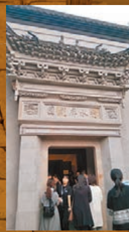
古香古色的秀水廊劇園