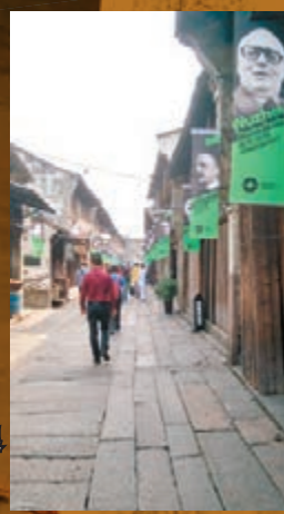
古鎮的巷弄裡掛起了中外戲劇家海報。