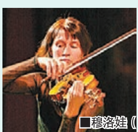
穆洛娃（V. Mullova）的演奏姿容。

如論名氣，穆洛娃可能較克萊曼更高，這自然是因為她的人生故事更為戲劇性。這位具有過人魅力的小提琴家在1980年和1982年先後在西貝流士及柴可夫斯基兩項國際大賽中奪冠而聲名鵲起，並成為當年蘇聯向西方展示軟實力的音樂明星，得以安排到西方登台演出，為此才能發生1983年自蘇聯出走西方轟動一時的新聞，這件出逃極權政府事件，更加速她的名氣上升。事實上，她充滿熱情，富有力量感和爆發力的演奏，當年確為樂壇帶來很大的刺激活力，不過，隨着年齡，人生的推進，藝術歷練的增加，明顯令她的音樂慢慢起了變化。月前她與BBC愛樂樂團在澳門文化中心演奏西貝流士的D小調小提琴協奏曲，多少讓人將她的反抗極權政府的人生故事，和西貝流士同樣是為芬蘭人爭取獨立的音樂鬥士聯想起來。不過，她這次的演奏幾乎有「返璞歸真」之感，尤其是終章充滿熱力激情的主題，變得內斂化，熱量不是沒有，但激情的火花少了，一切都變得冷靜，她的琴音便仿如是在訴說別人的故事一樣……只是穆洛娃的「星級」魅力仍在，觀眾的熱烈掌聲仍保持着一定的高溫，也得以多聽她加奏了一曲長約三分鐘的巴哈作品—G小調第一奏鳴曲的柔板（adagio）。