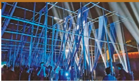
染布坊晚上的演出。