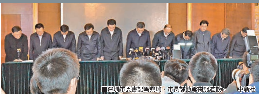
深圳市委書記馬興瑞、市長許勤等鞠躬道歉。中新社

香港文匯報訊(記者 何花 綜合報道)國務院深圳光明新區「12·20」滑坡災害調查組經調查認定,此次滑坡災害是一起受納場渣土堆填體的滑動,不是山體滑坡,不屬於自然地质灾害,是一起生產安全事故。在12月25日稍後舉行的發佈會上,深圳市委書記馬興瑞、深圳市長許勤鞠躬道歉。