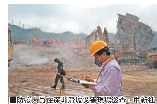
防疫人員在深圳滑坡災害現場巡查。

記者了解到,目前,萬測公司在塘尾村的新廠合同已生效,預計近兩日就能接單,3到5日恢復生產。