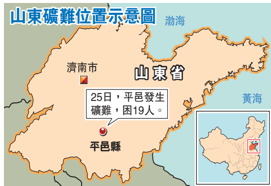
山東礦難位置示意圖。25日,平邑發生礦難,困19人。