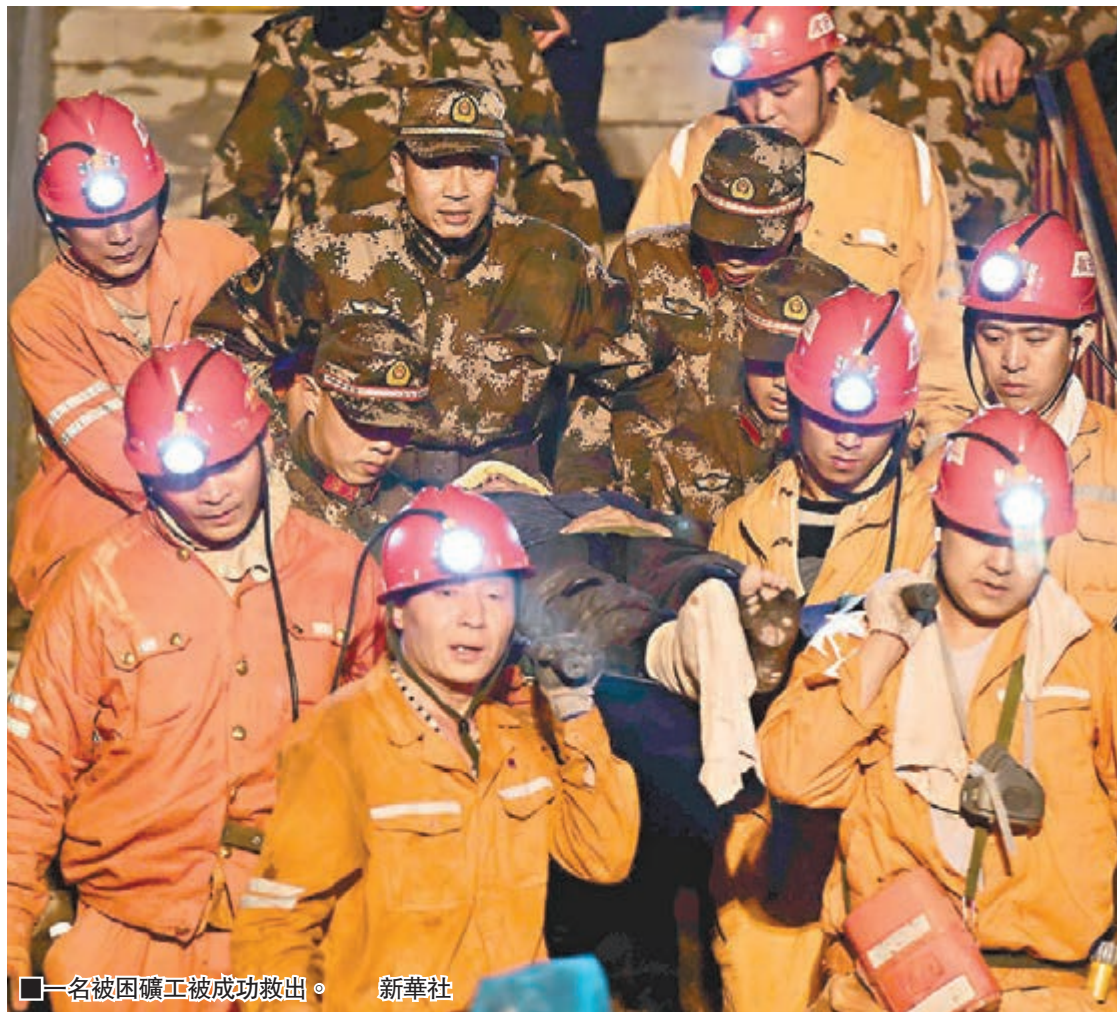
一名被困礦工被成功救出。

據悉,平邑玉榮商貿有限公司註冊資本為500萬元人民幣,成立於2003年4月18日,公司所在地為平邑縣保太鎮德埠莊村,經營範圍為:石膏開採(有效期限以許可證為準);石膏銷售;工程機械設備租賃;農副產品購銷(不含糧食、棉花、煙草、蠶繭)。據了解,肇事的石膏礦已開採了28年。