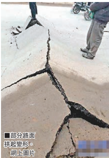
部分路面拱起變形。