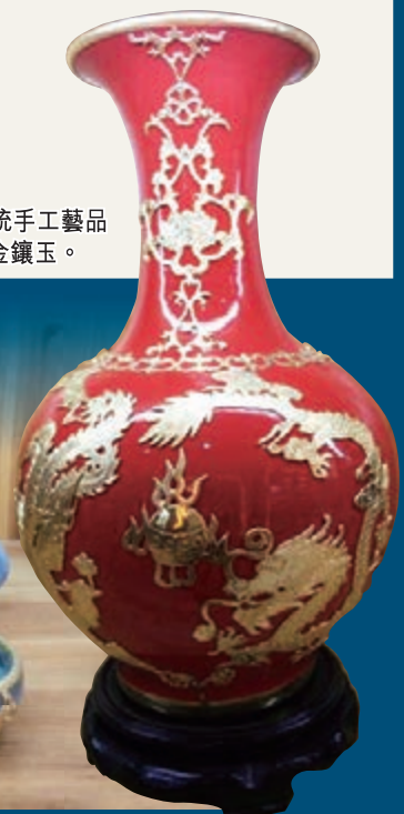
■傳統手工藝品——金鑲玉。

姚莊金鑲玉始於清朝乾隆年間，距今已有二百年歷史，其產品主要採用馳名中外的景德鎮瓷器、鈞瓷、汝瓷、宜興紫砂、名貴玉器為主要載體，選金銀為飾品，利用現代技術，採用古老工藝，經治煉鑄造、鏤雕、鑲嵌、光潔處理等幾十道工序，精雕細刻製成。把中國傳統文化中的福、祿、壽、喜，吉祥如意，名花異草，珍禽異獸等圖案鑲於陶瓷器皿上，形象自然，栩栩如生，具有鮮明的民族地域文化特色和強烈的藝術魅力。現今，姚莊已發展金鑲玉工藝品廠5家，從業人員300多人，年產值3,000多萬元，產品遠銷北京、上海、港、澳、台等地和馬來西亞、新加坡等國。