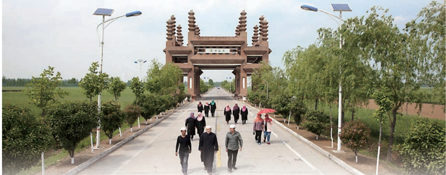
■具有回族風情特色的牌坊——姚莊在望。

20餘家民族特色餐廳每天吸引着千餘食客前來品嚐玉泉茶水、金雞玉兔、犍花牛肉等特色食品；一汪玉泉水引來了馬來西亞投資商，境域內純淨水、礦泉水廠多達五家；極具地方特色的金鑲玉等傳統工藝品曾作為國賓禮品或省裡禮品送給俄羅斯總統普京、國民黨榮譽主席連戰、台灣海基會原董事長江丙坤……面積不足8平方公里、人口不足萬人的豫中小鎮，卻因「回族風情古鎮、茶食文化之鄉」之盛名享譽中原，這就是河南郊縣姚莊回族鄉。