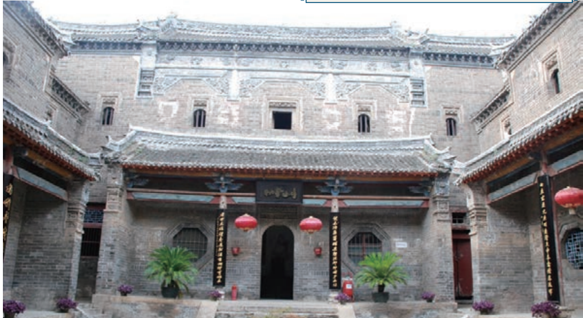
葉氏莊園建築精良,氣勢恢宏。

進入葉氏莊園,門樓上、山牆上、樑架上、枋檁上、屋脊上大大小小的磚雕、木雕俯拾即是,數以