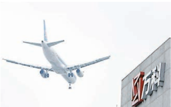
鉅盛華12月18日以每股均價23.304元人民幣增持萬科8,196萬股。資料圖片

對於有媒體報道稱華潤旗下的華潤信託是寶能地產第二大股東,華潤昨天發佈公告澄清。指出公司曾設立一信託計劃,由信託計劃持有部分寶能地產股份,但該信託計劃已於2015年6月結束,信託計劃持有的寶能地產股份已於