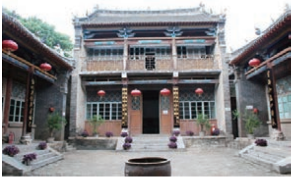
「三進堂樓院」大廳院大廳。

萬計,或花鳥、或人物,無不栩栩如生,惟妙惟肖。所有雕刻採取浮雕、透雕、鏤雕等多種技法,工藝精湛、手法細膩、堪稱一絕。木雕多集中在門樓、暴廈或柱頭上,丹青酣灑,色澤豔麗。中院門樓上一斗拱名曰百龍呈祥,在幾根僅有碗口粗的木柱上刻有大大小小各種形態的龍100多條,而且個個形神兼備、精妙絕倫。前後樓頂皆用花脊,所雕牡丹枝葉肥碩、雍容華貴。整個宅園顯得典雅、高貴、大氣,堪稱中華民間藝術寶庫中的一朵奇葩,凡來觀