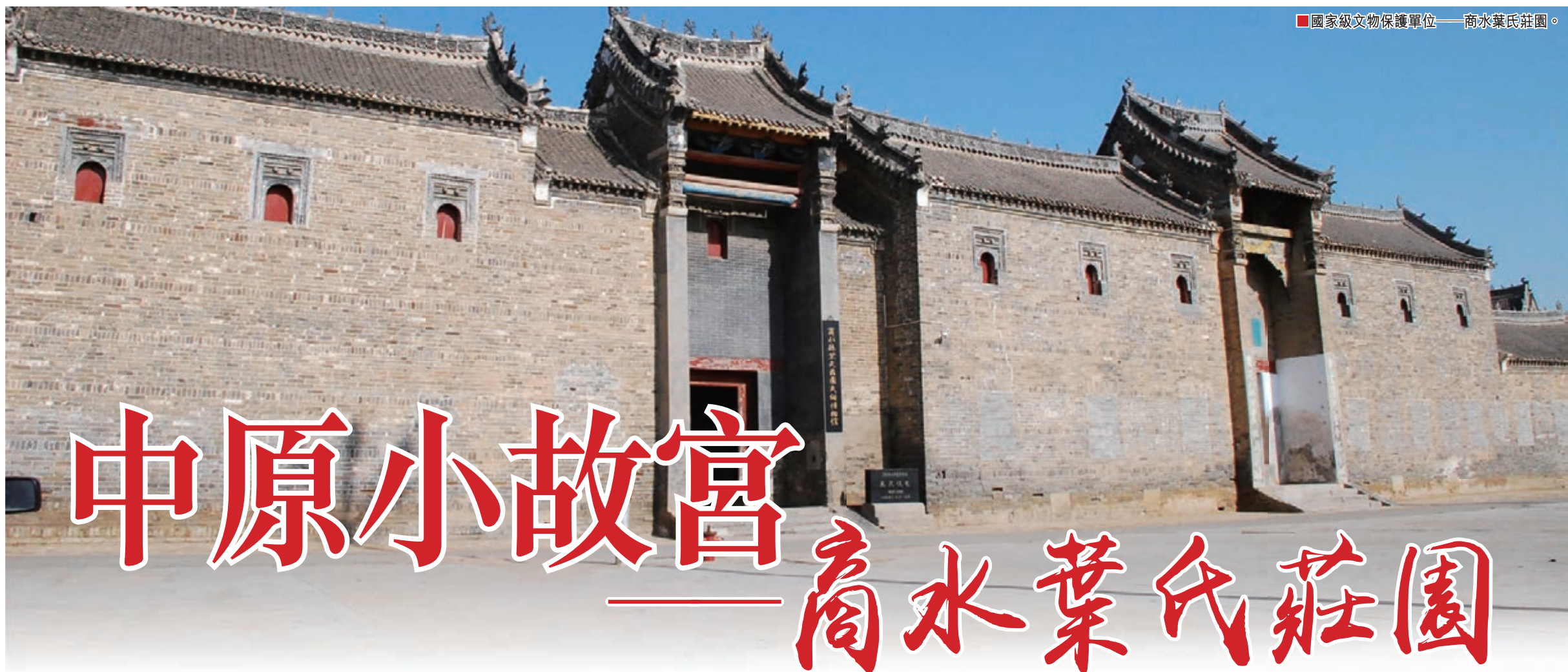
國家級文物保護單位——商水葉氏莊園。

通過是次整合,中石油能夠順應各個管道營運公司之間的股權關係,建立統一的管道資產管理營運及投融資平台,從而進一步提升管理效率,節約營運成本,並為統籌規劃實施未來管道建設打下堅實的基礎,有利於提升管道資產整體價值。