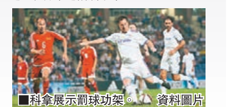
科拿展示罰球架。資料圖片

由史高斯、皮利斯和科拿等領銜的16名英超傳奇球星今年10月訪港，與由「五一九」核心球員組成的「香港傳奇」隊在小西灣運動場合演一場邀請賽，颯起一陣英超懷舊旋風，最終兩軍名宿寶刀未老，合力炮製9個入球，英超大師以5:4險勝，其中史高斯施展重炮絕技，令全場逾7千球迷拍爛手掌。