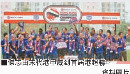
傑志由末代港甲威到首屆港超聯。資料圖片

首屆香港超級聯賽(港超聯)今年5月中結束，末代港甲冠軍傑志在港超聯時代首個球季便贏得聯賽、盃賽和足總盃冠軍，加冕「三冠王」，而另一傳統球會東方奪得高級組銀牌錦標，南華則四大皆空，只能在季後附加賽奪冠，繼續獲得出戰亞協盃的資格。