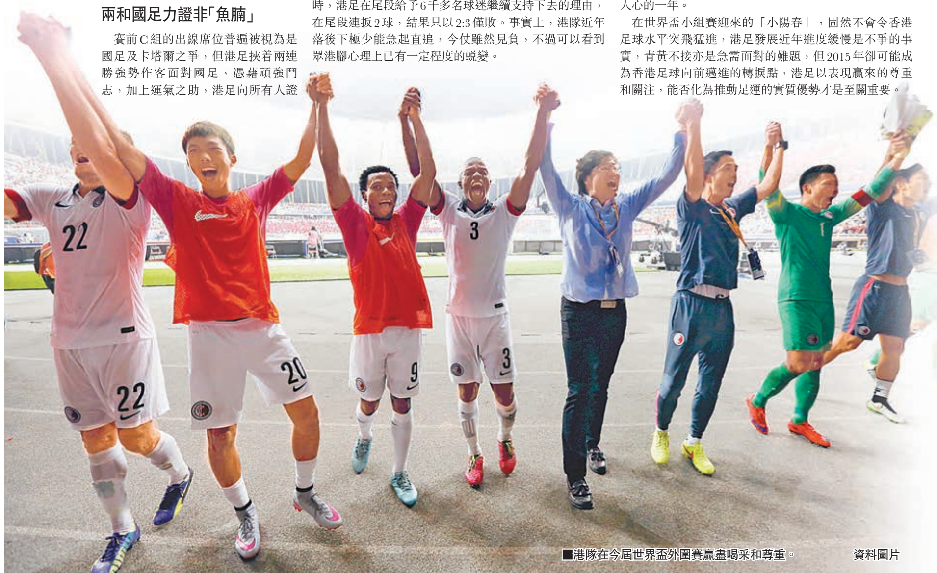
港隊在今屆世界盃外圍賽贏盡喝采和尊重。資料圖片

對國足一戰，港足多次倖保不失，藉一口氣堅持至完場，而回歸主場面對同組實力最強的卡塔爾，港足才真正展現出令人動容的不屈鬥志。當戰至84分鐘仍落後0:3時，港足在尾段給予6千多名球迷繼續支持下去的理由，在尾段連扳2球，結果只以2:3僅敗。事實上，港隊近年落後下極少能急起直追，今仗雖然見負，不過可以看到眾港腳心理上已有一定程度的蛻變。